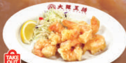
TAKE OUT 小海老の天ぷら(8尾) 780円 (税込)