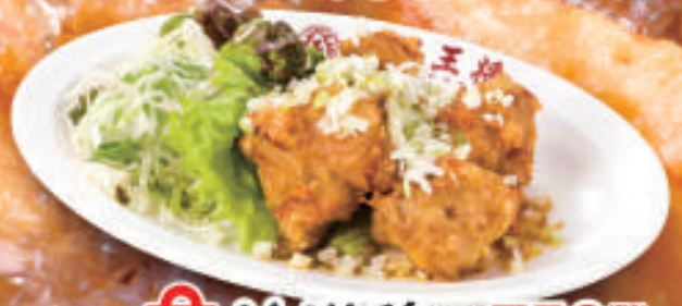
TAKE OUT 油淋鶏 750円 (税込)