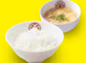
ごはんセット 350円(税込)