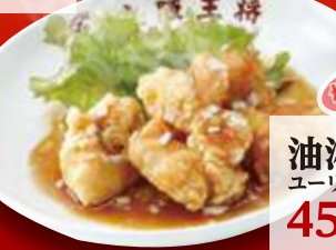
桜島 油淋鶏(小) ユーリンチー 450円 (税込)