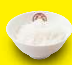
白ごはん 300円 / 小 180円 (税込) (税込)