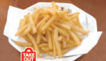
TAKE OUT フライドポテト 380円 (税込)