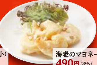
海老のマヨネーズ(小) 490円 (税込)