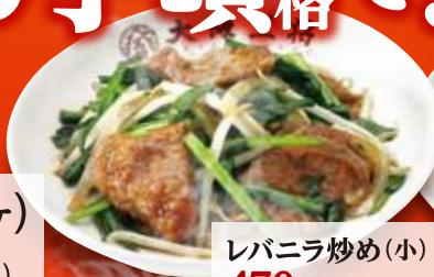
レバニラ炒め(小) 470円 (税込)