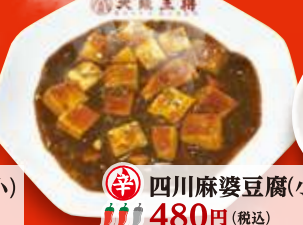
辛 四川麻婆豆腐(小) 480円 (税込)