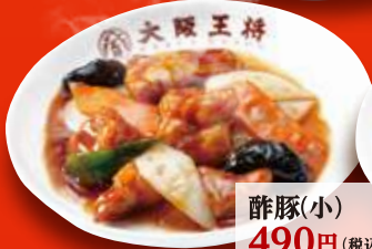
酢豚(小) 490円 (税込)