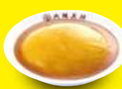
天津飯 650円 / 小 450円 (税込) (税込)