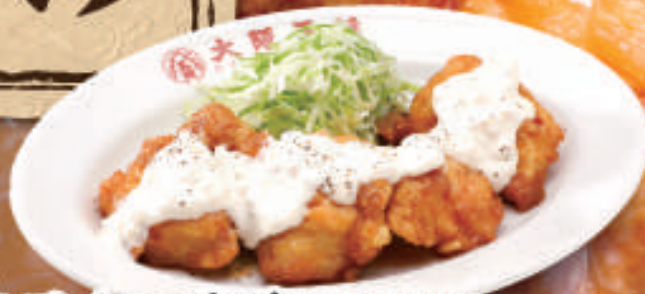
TAKE OUT チキン南蛮 750円 (税込)