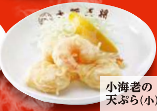
小海老の 天ぷら(小) 460円 (税込)