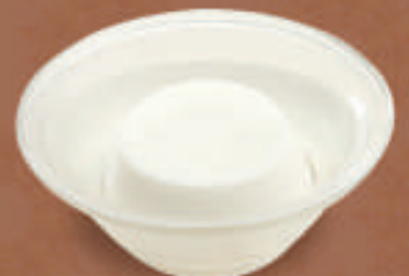
杏仁豆腐 350円 (税込)