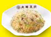
五目炒飯 650円 / 小 450円 (税込) (税込)