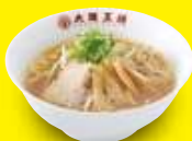
醤油ラーメン 680円 / 小 500円 (税込) (税込)