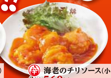
辛 海老のチリソース(小) 560円 (税込)