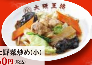
肉と野菜炒め(小) 450円 (税込)