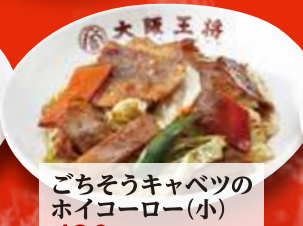
ごちそうキャベツの ホイコーロー(小) 490円 (税込)