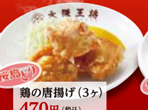
鶏の唐揚げ(3ヶ) 470円 (税込)