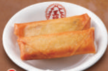
TAKE OUT 春巻き(2本) 360円 (税込)