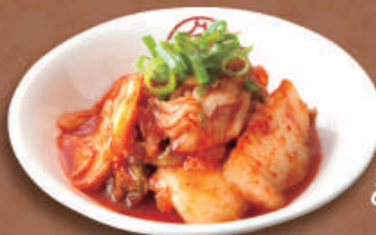
キムチ 350円 (税込)