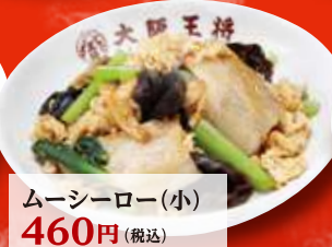
ムーシーロー(小) 460円 (税込)