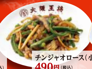
チンジャオロース(小) 490円 (税込)