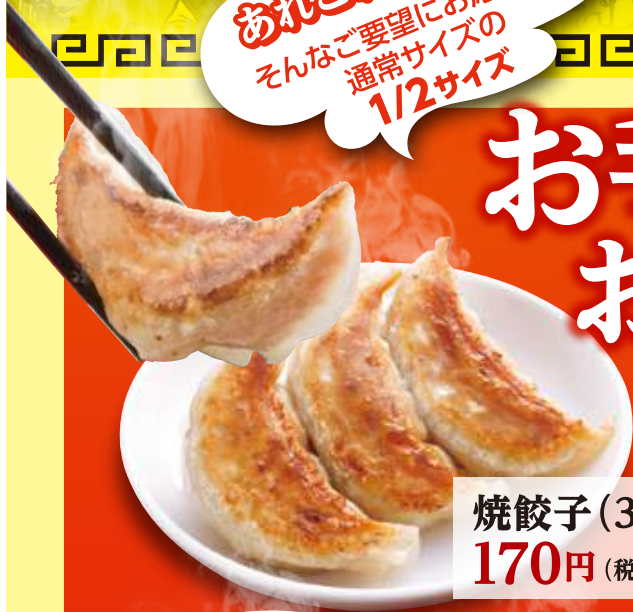
焼餃子(3ヶ) 170円 (税込)