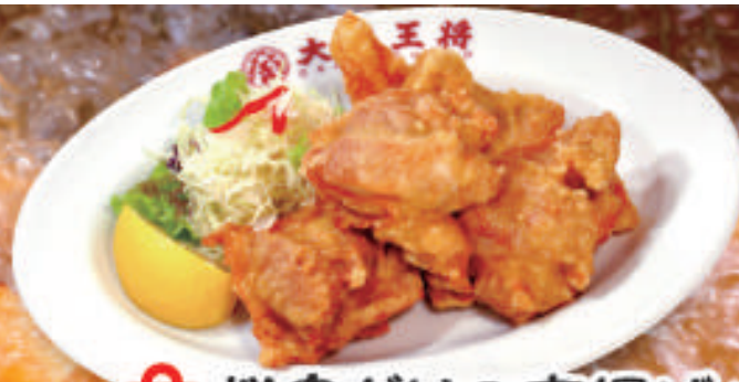
TAKE OUT 桜島どりの唐揚げ(5ヶ) 750円 (税込)