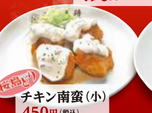
チキン南蛮(小) 450円 (税込)