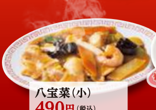
八宝菜(小) 490円 (税込)