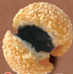
TAKE OUT ゴマ団子 (2ヶ) 350円 (税込)