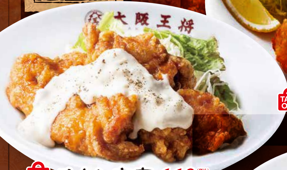
TAKE OUT チキン南蛮 660円 (税込)