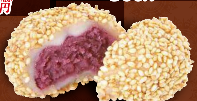
TAKE OUT 紫芋のゴマ団子 (2個) 300円 (税込)