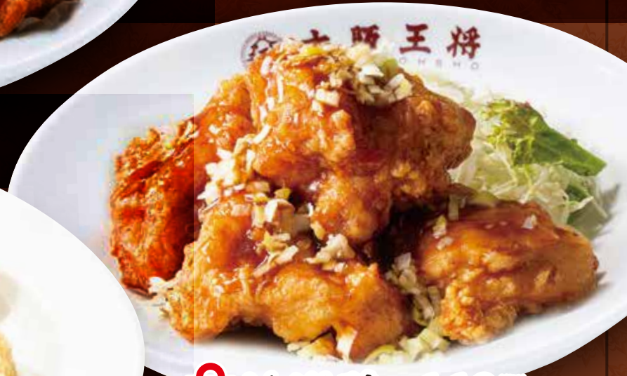
TAKE OUT 油淋鶏 660円 (税込)