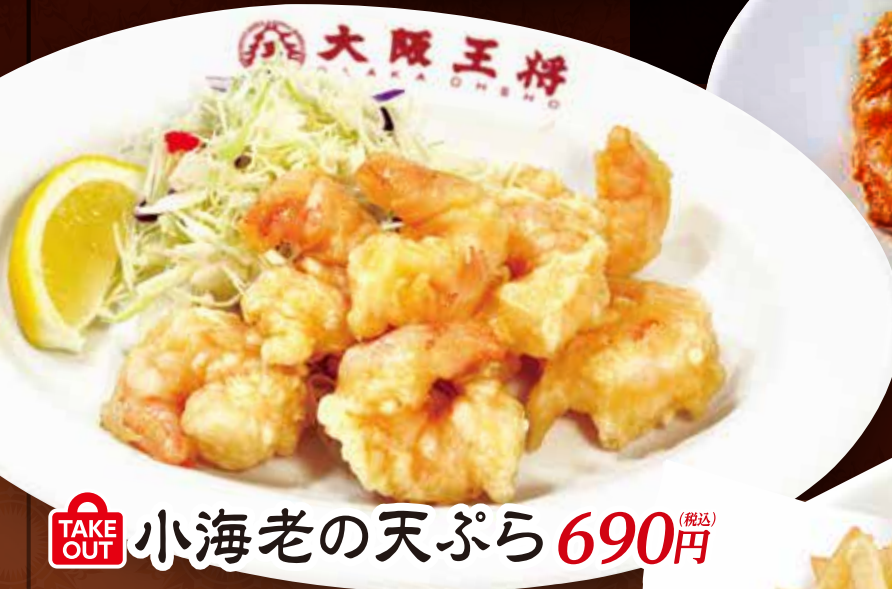
TAKE OUT 小海老の天ぷら 690円 (税込)