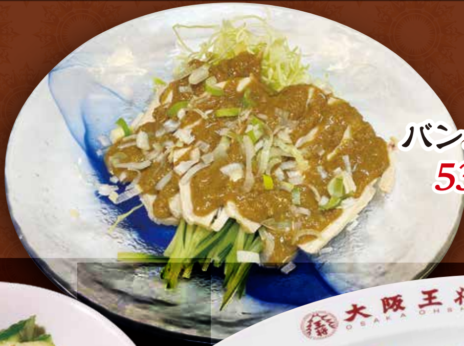
バンバンジー 530円 (税込)