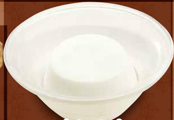
杏仁豆腐 300円 (税込)