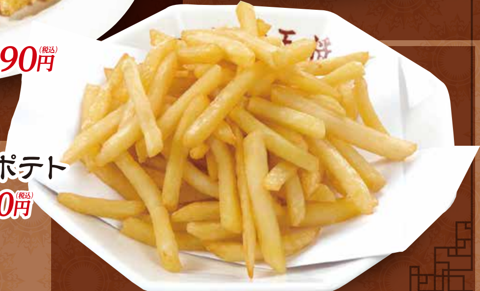
TAKE OUT フライドポテト 380円 (税込)