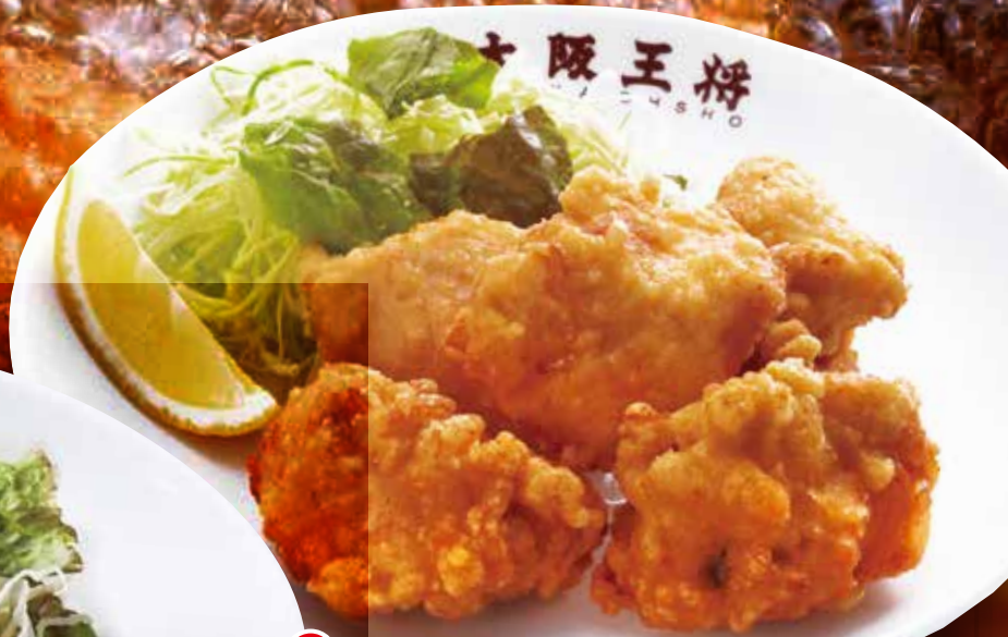
TAKE OUT 唐揚げ 5個 690円 (税込)