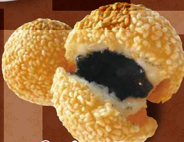
TAKE OUT ゴマ団子(2個) 300円 (税込)