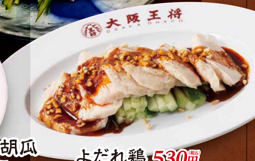
よだれ鶏 530円 (税込)