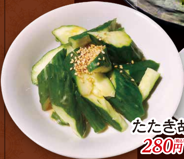
たたき胡瓜 280円 (税込)