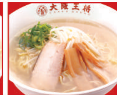
塩ラーメン 650円(税込)