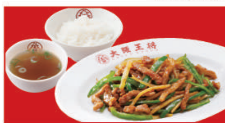
チンジャオロース定食 チンジャオロースハーフ・ご飯・ スープ 950円(税込)