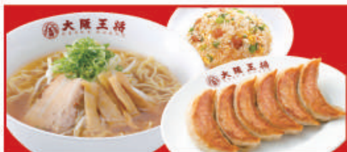
王将セット 選べるラーメン(醤油・とんこつ・塩) 餃子1人前・五目炒飯ハーフ 1,200円(税込)

丼・ご飯 大盛 +110円(税込) | 炒飯 大盛 +210円(税込) | 唐揚げ(2個) 270円(税込)