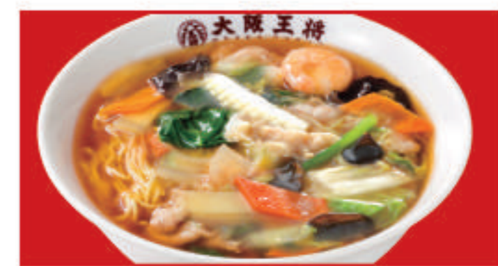
五目あんかけラーメン 850円(税込)