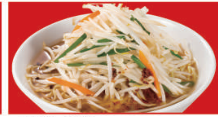
もやしそば 750円(税込)