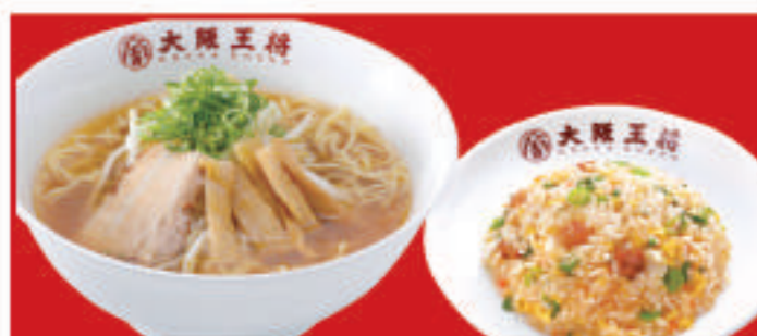
半チャンセット 選べるラーメン(醤油・とんこつ・塩)・ 五目炒飯ハーフ 980円(税込)