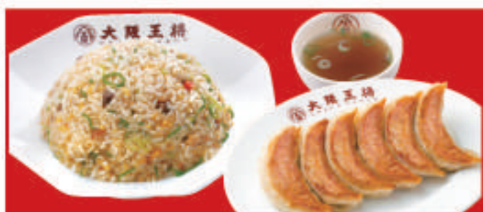
炒飯&餃子セット 餃子1人前・五目炒飯・スープ 850円(税込)