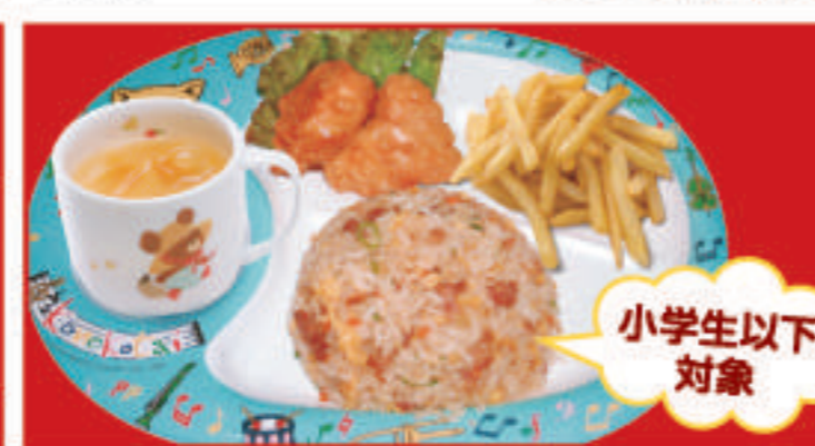
キッズプレート 炒飯・唐揚げ・ポテト・ オレンジジュース 550円(税込) 小学生以下対象