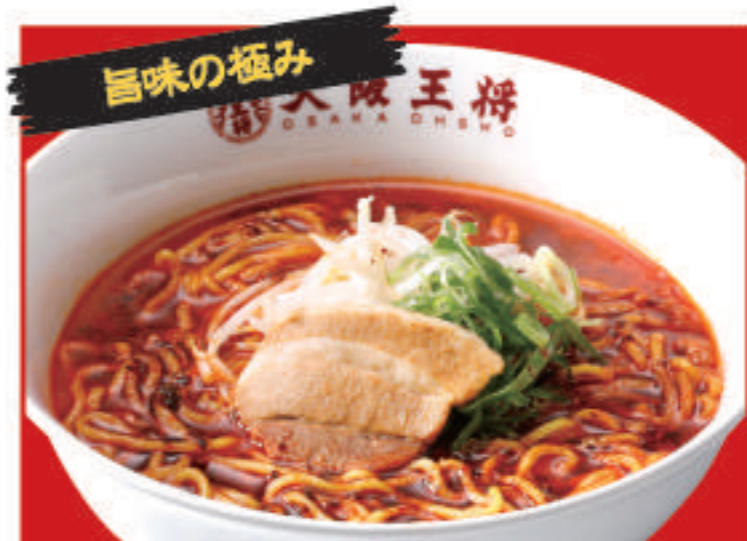
炎のラーメン 780円(税込)