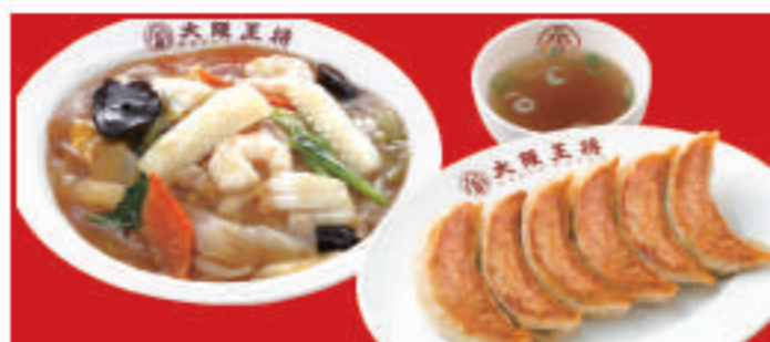
中華丼&餃子セット 餃子1人前・中華丼・スープ 980円(税込)