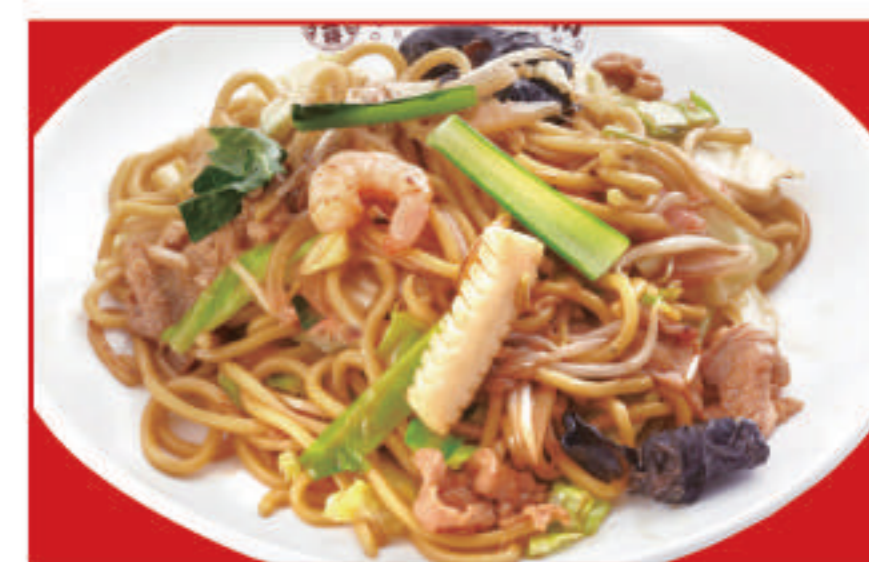
もちもち太麺の炒め焼きそば 750円(税込)