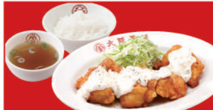
チキン南蛮定食 チキン南蛮・ご飯・スープ 890円(税込)