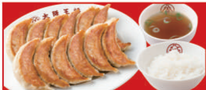
餃子定食 餃子2人前・ご飯・スープ 840円(税込)