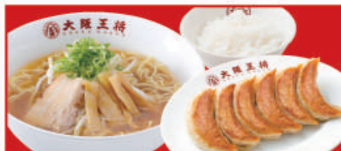
王将定食 選べるラーメン(醤油・とんこつ・塩) 餃子1人前・ご飯 1,080円(税込)