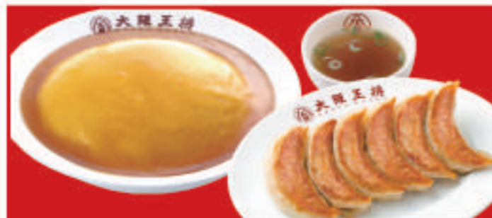
天津飯&餃子セット 餃子1人前・天津飯・スープ 780円(税込)