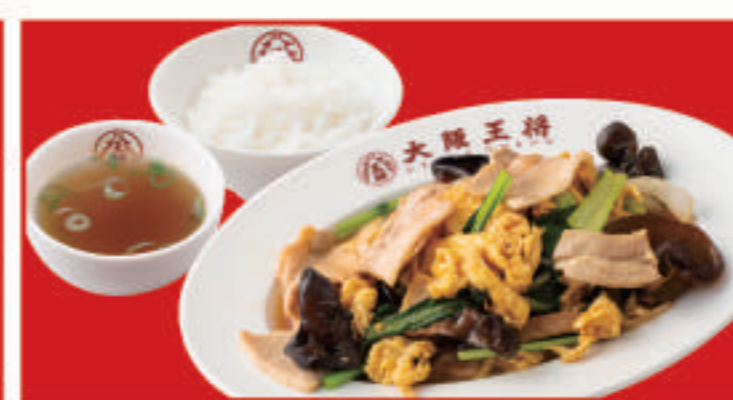
ムーシーロー定食 ムーシーロー・ご飯・スープ 890円(税込)