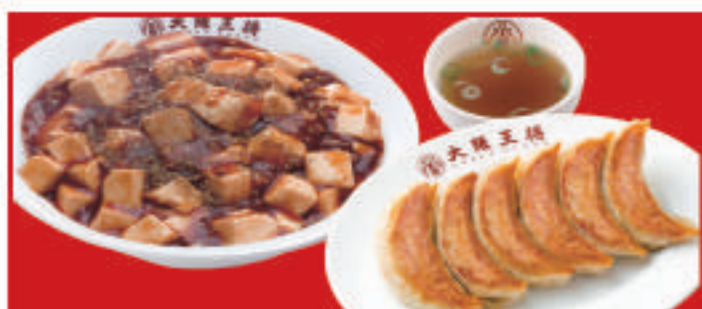
麻婆丼&餃子セット 餃子1人前・麻婆丼・スープ 980円(税込)