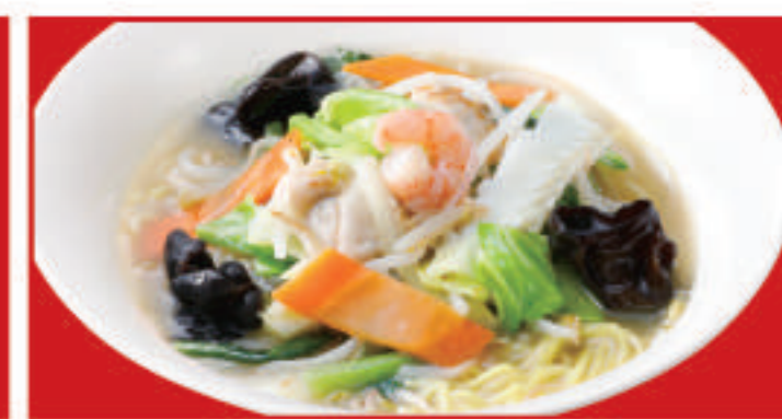
大阪チャンポン 850円(税込)