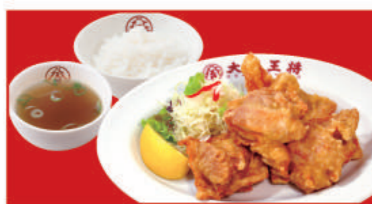
鶏の唐揚げ定食 鶏の唐揚げ・ご飯・スープ 890円(税込)