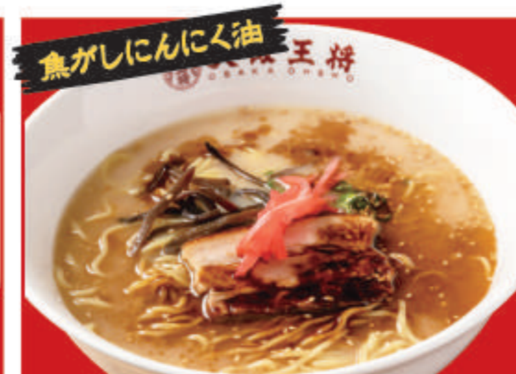
黒とんこつラーメン 700円(税込)