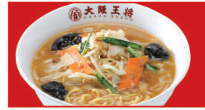
野菜たっぷり味噌ラーメン 850円(税込)