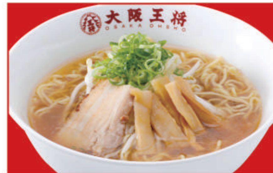
醤油ラーメン 650円(税込)

単品ラーメン類をご注文に限り (焼きそば・血うどん除く) 370円(税込) で 「セットハーフ炒飯」お付け出来ます。