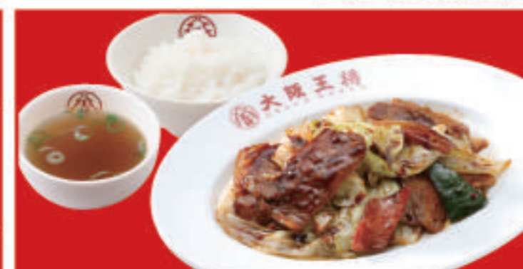
ホイコーロー定食 ホイコーローハーフ・ご飯・ スープ 890円(税込)