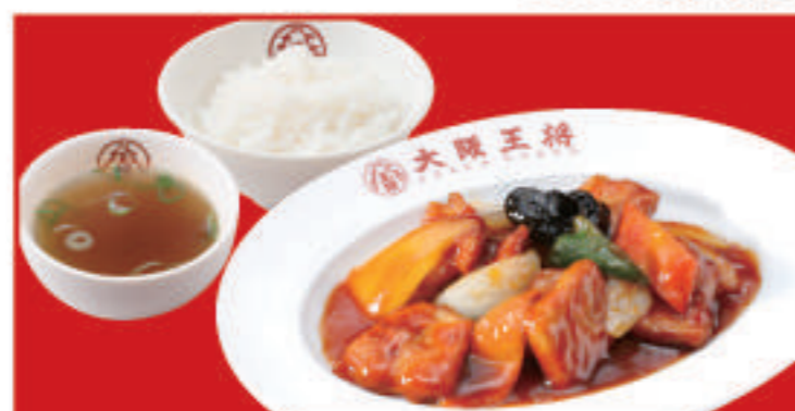
酢豚定食 酢豚ハーフ・ご飯・スープ 890円(税込)