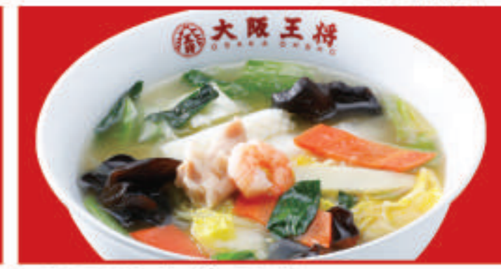
五目野菜汁そば 800円(税込)