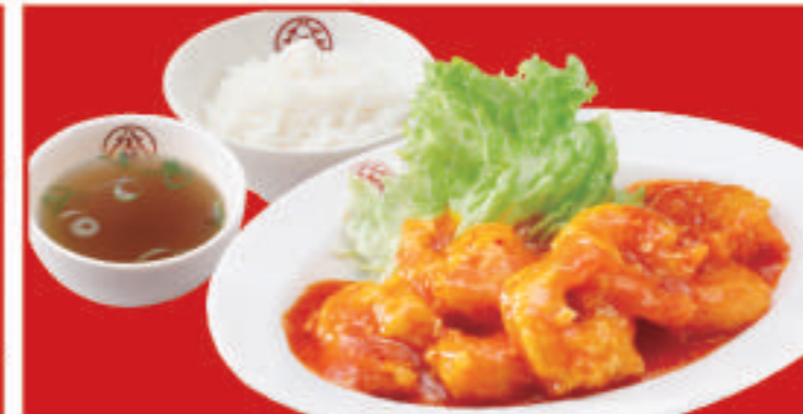
海老チリ定食 海老のチリソースハーフ・ ご飯・スープ 1,000円(税込)