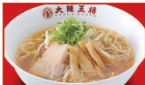
中華そば 650円(税込) 中華そば(小) 500円(税込)