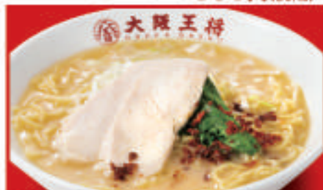
鶏白湯ラーメン 750円(税込)