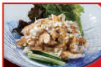
バンバンジー 650円(税込)