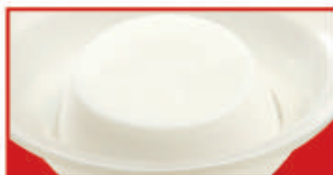
さわやか杏仁豆腐 330円(税込)