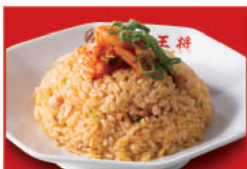
牛ムチ炒飯 810円(税込)