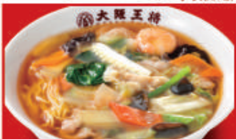
五目あんかけラーメン 900円(税込)