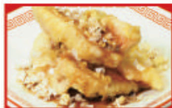
白身魚の葱ソースがけ 880円(税込)