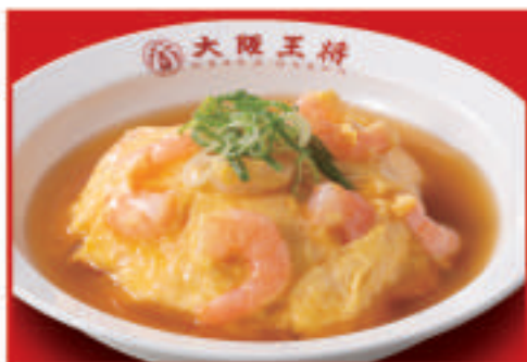
エビ玉天津飯 800円(税込)