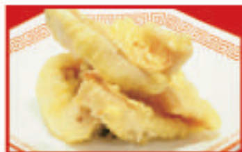
白身魚の天ぷら 840円(税込)