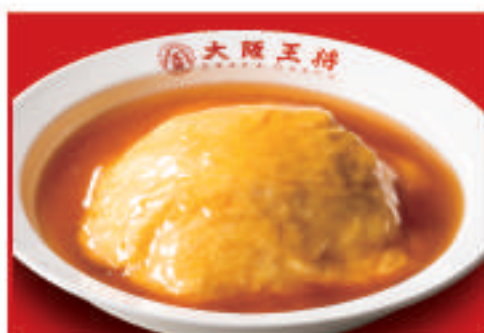
ふわとろ天津飯 630円(税込)