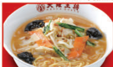
野菜たっぷり味噌ラーメン 930円(税込)