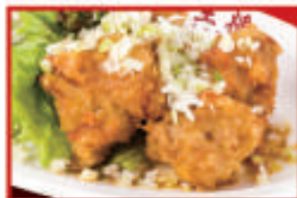
油淋鶏 (4ヶ) 780円(税込)