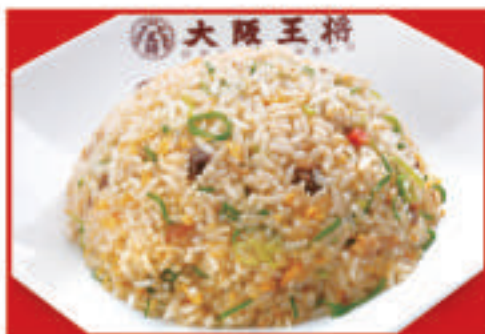
五目炒飯 630円(税込) 五目炒飯(ハーフ)480円(税込)