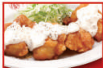
チキン南蛮 (4ヶ) 780円(税込)