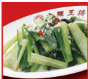
青菜ガーリック炒め