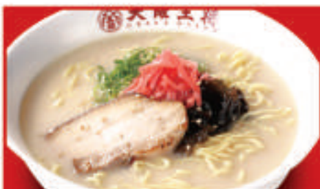
とんこつラーメン 750円(税込)