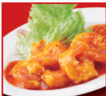
海老のチリソース