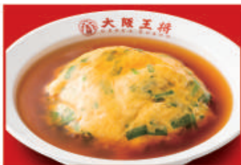
ニラ玉天津飯 780円(税込)