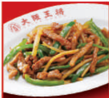
チンジャオロース