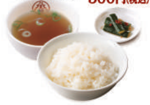
ごはんセット 300円(税込) ご飯・スープ・漬物