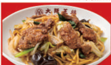
レバ入り焼きそば 880円(税込)