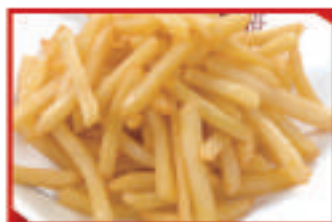
フライドポテト 450円(税込)