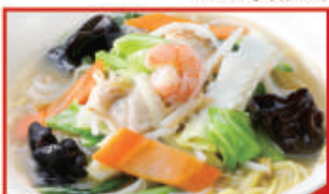
野菜タンメン 900円(税込)