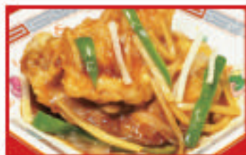
白身魚の甘酢あんかけ 880円(税込)