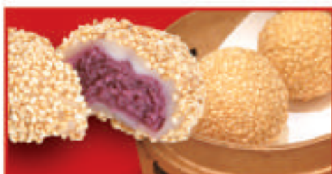
紫芋のゴマ団子 380円(税込)