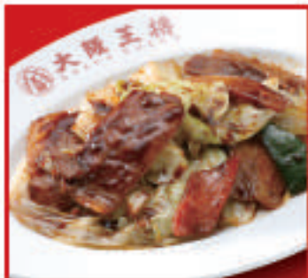
ごちそうキャベツの回鍋肉