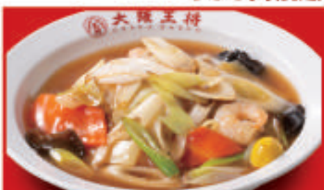
葱あんかけからしそば 880円(税込)