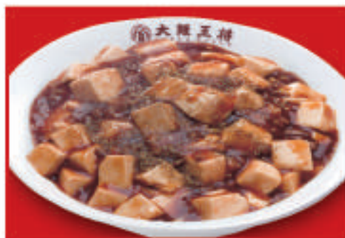
四川麻婆丼 800円(税込)