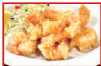
小海老の天ぷら 780円(税込)