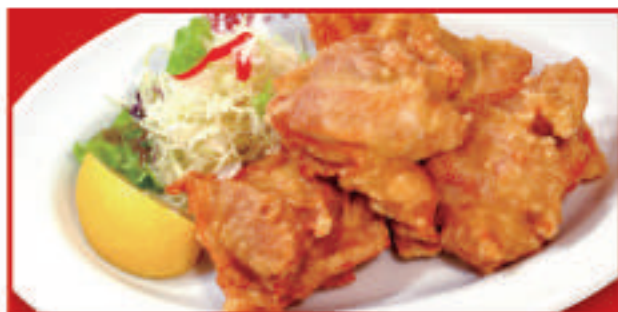
唐揚げ (4ヶ) 750円(税込)