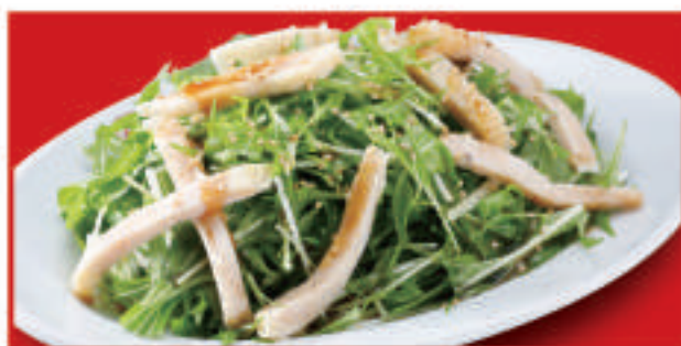
蒸し鶏の和風サラダ 650円(税込)