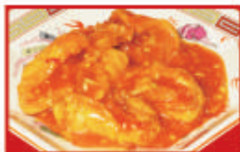
白身魚のチリソース 920円(税込)