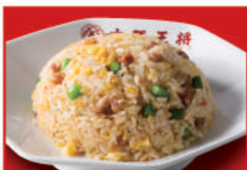
ニンニク炒飯 810円(税込)