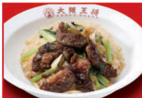
牛カルビ炒飯 1,030円(税込)