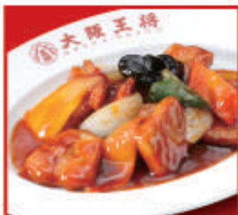
野菜たっぷり酢豚