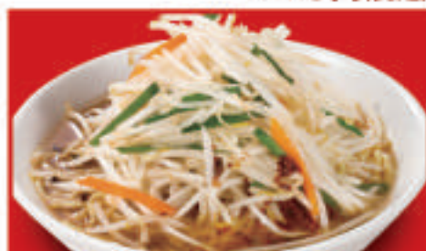
もやしそば 850円(税込)