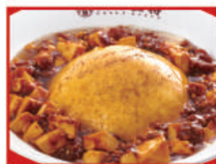
ふわとろ麻婆天津飯 820円(税込)