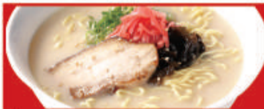
とんこつラーメン 680円(税込)