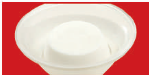
さわやか杏仁豆腐