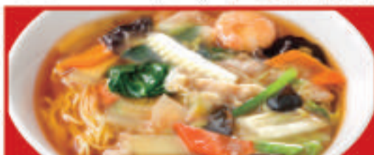
五目あんかけラーメン 850円(税込)