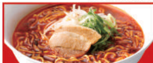
炎ラーメン 800円(税込)