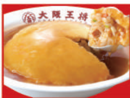
ふわとろ天津炒飯 760円(税込)