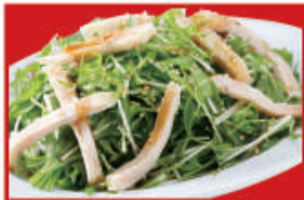
蒸し鶏の和風サラダ