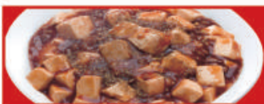
四川麻婆丼 750円(税込) 四川麻婆丼 (小) 550円(税込)