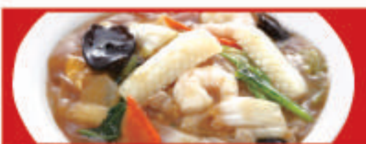
中華丼 750円(税込) 中華丼 (小) 550円(税込)