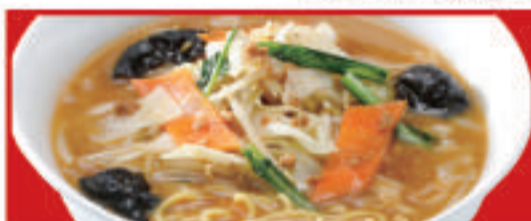
野菜たっぷり味噌ラーメン 850円(税込)