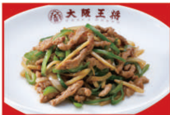
チンジャオロース