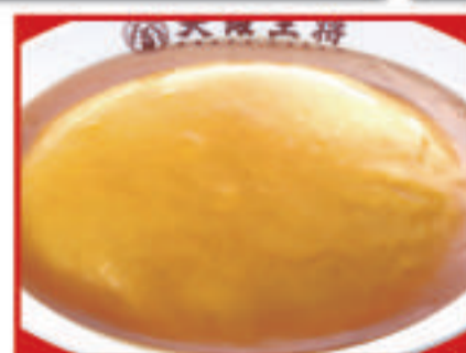
ふわとろ天津飯 530円(税込) ふわとろ天津飯(小) 390円(税込)