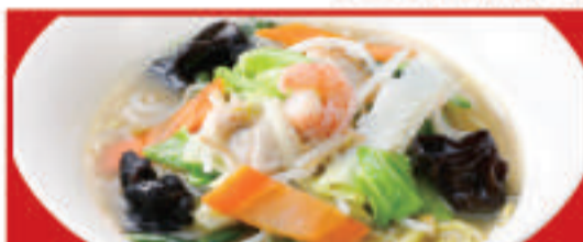
大阪チャンポン 850円(税込)