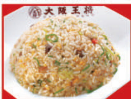
五目炒飯 600円(税込) 五目炒飯 (小) 400円(税込)