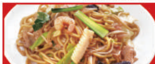
もちもち太麺の炒め焼きそば 700円(税込)