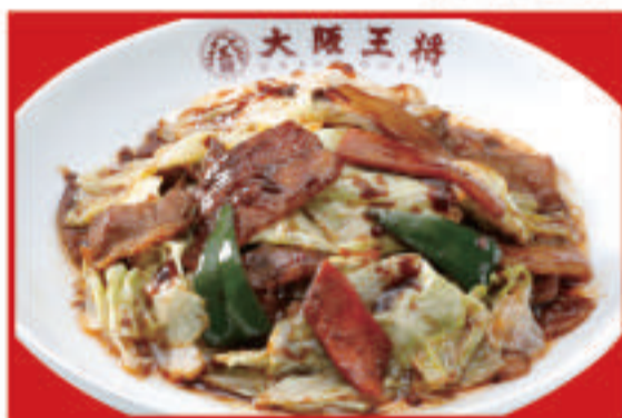
ごちそうキャベツの回鍋肉