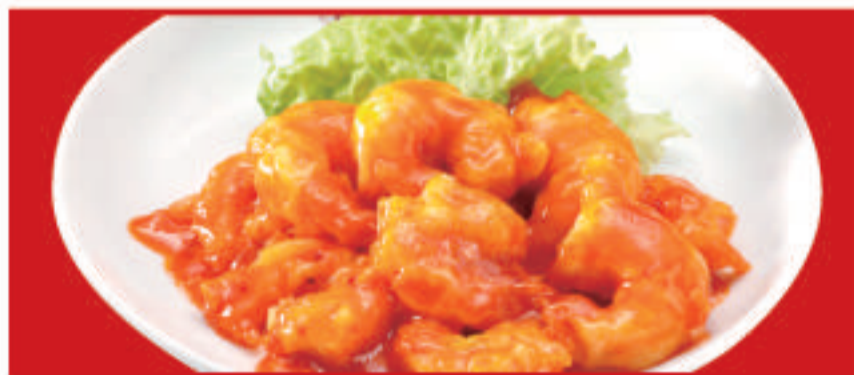
海老のチリソース