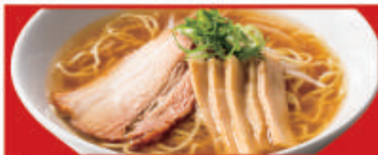
中華そば 650円(税込) 中華そば (小) 420円(税込)