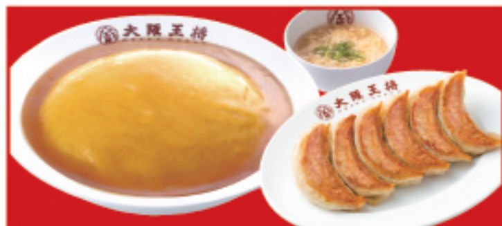
天津飯&餃子セット 840円(税込) 餃子1人前・天津飯・スープ