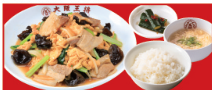
ムーシーロー定食