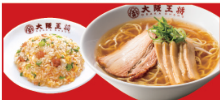
半チャンセット(中華そば) 1,020円(税込) 中華そば・五目炒飯ハーフ