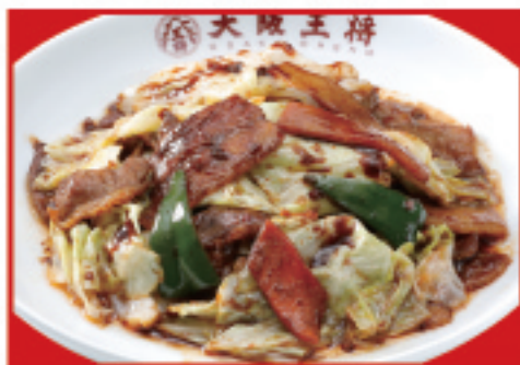
ごちそうキャベツの回鍋肉