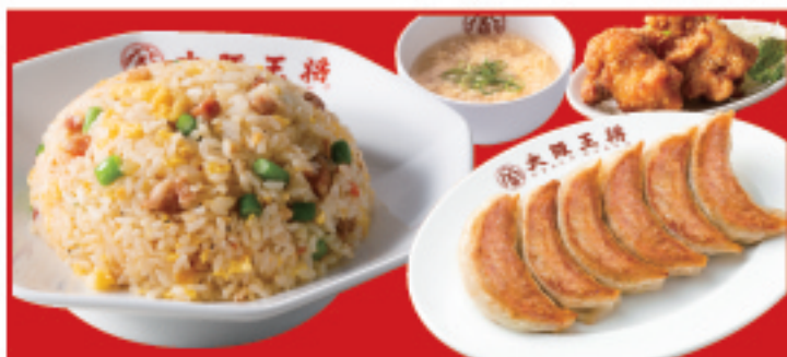
餃子&ニンニク炒飯セット 1,250円(税込) 餃子1人前・ニンニク炒飯・唐揚げ2個・スープ