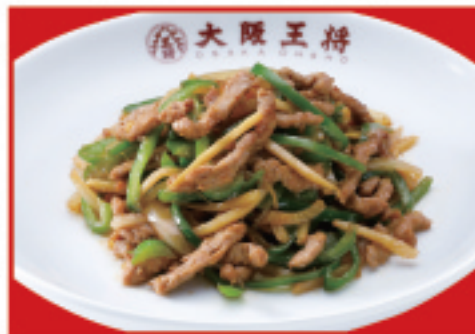
チンジャオロース