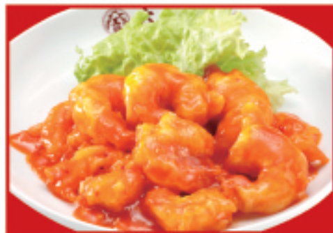
海老のチリソース