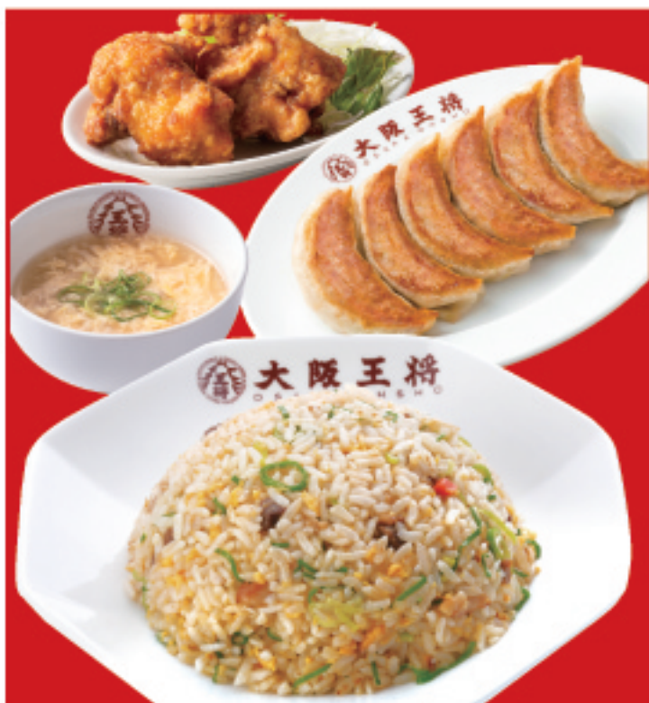
餃子セット(シングル) 1,100円(税込) 餃子1人前・五目炒飯・唐揚げ2個・スープ