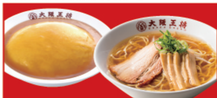
天津飯ラーメンセット 1,200円(税込) 天津飯・中華そば