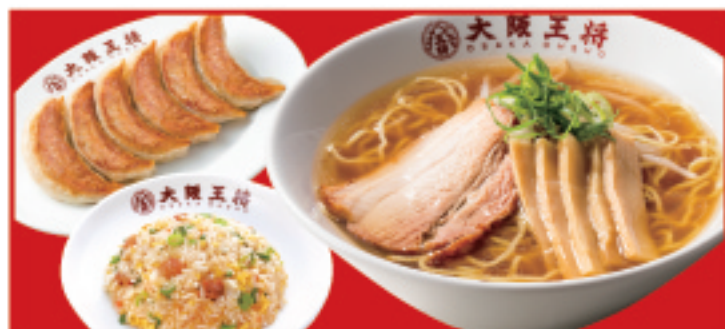
王将セット 1,310円(税込) 餃子1人前・中華そば・五目炒飯ハーフ