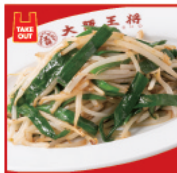
ニラもやし炒め 580円(税込)