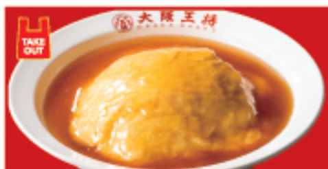
ふわとろ天津飯 520円(税込)