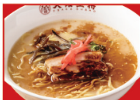
黒とんこつラーメン 680円(税込)