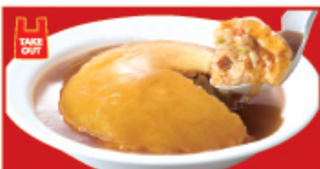
ふわとろ天津炒飯 750円(税込)