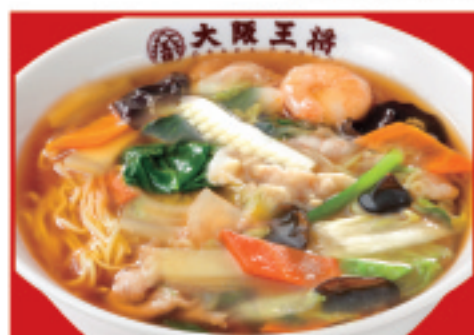
五目あんかけラーメン 800円(税込)