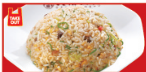
五目炒飯 540円(税込) ハーフ 400円(税込)