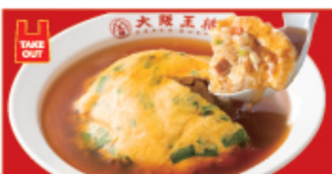
ニラ玉天津炒飯 730円(税込)