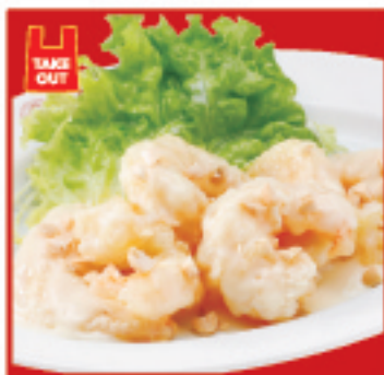
海老のマヨネーズ 800円(税込)