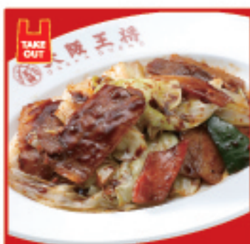
ごちそうキャベツの 回鍋肉 750円(税込)