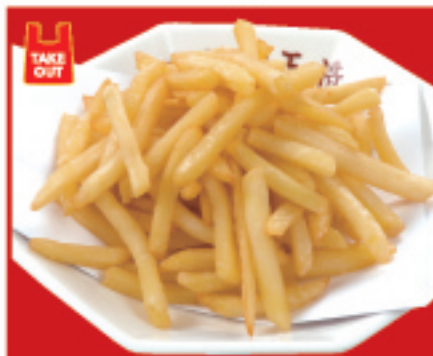
フライドポテト 350円(税込)