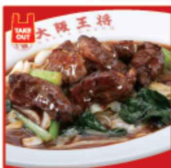
牛カルビ炒め 880円(税込)