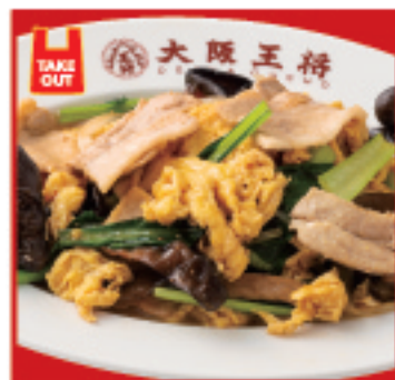
ムーシーロー 680円(税込)