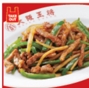
チンジャオロース 780円(税込)