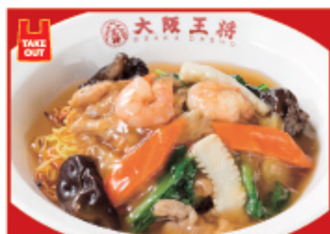
広東あんかけ焼きそば 820円(税込)