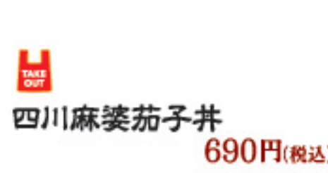
四川麻婆茄子丼 690円(税込)