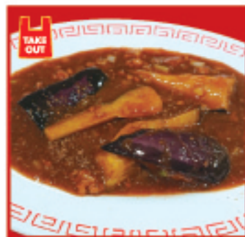
四川麻婆茄子 700円(税込)