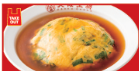
ニラ玉天津飯 660円(税込)