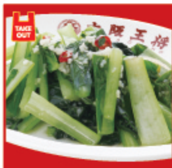
青菜ガーリック炒め 600円(税込)