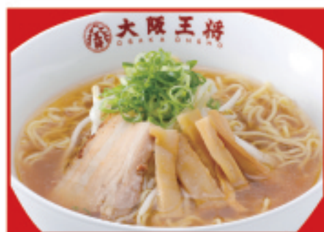
中華そば 580円(税込) (ハーフ) 420円(税込)