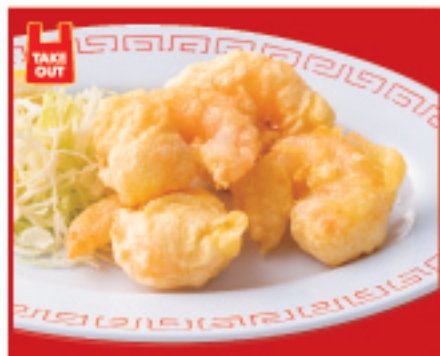
小海老の天ぷら 700円(税込)