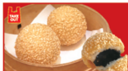
ゴマ団子(2個) 350円(税込)