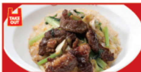
牛カルビ炒飯 960円(税込)