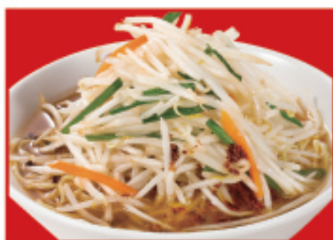
もやしそば 730円(税込)