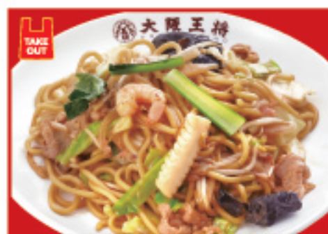
もちもち太麺の炒め焼きそば 730円(税込)