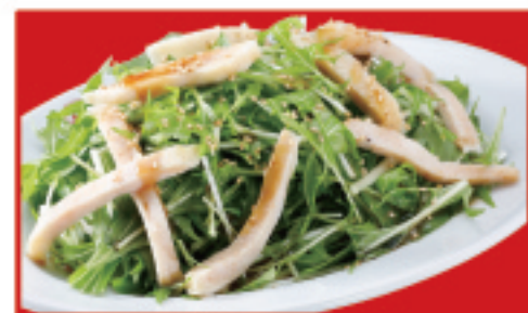
蒸し鶏の和風サラダ 500円(税込)