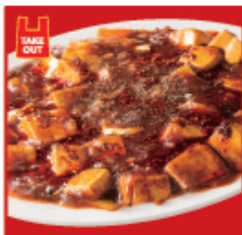
四川麻婆豆腐 700円(税込)