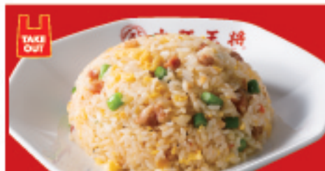
ガーリック炒飯 680円(税込)