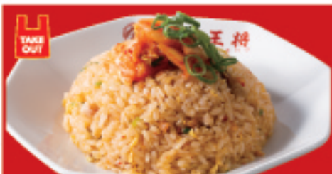
キムチ炒飯 680円(税込)