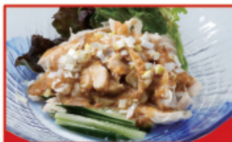
バンバンジー 550円(税込)