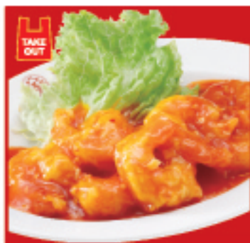
海老のチリソース 880円(税込)