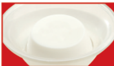
さわやか杏仁豆腐 330円(税込)