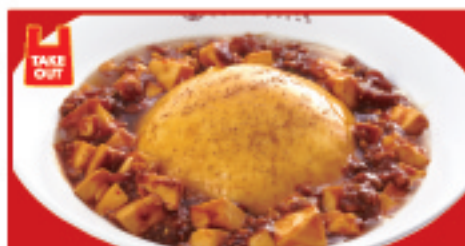
ふわとろ麻婆天津飯 780円(税込)