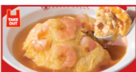
エビ玉天津炒飯 770円(税込)