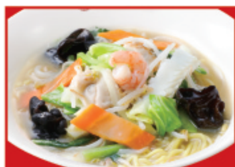
野菜タンメン 830円(税込)