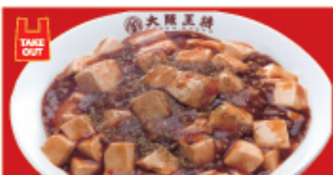
四川麻婆丼 680円(税込)