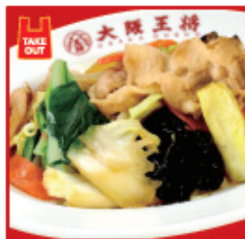
肉と野菜炒め 680円(税込)