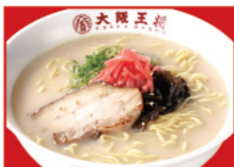
とんこつラーメン 650円(税込)