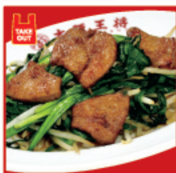
レバニラ炒め 720円(税込)