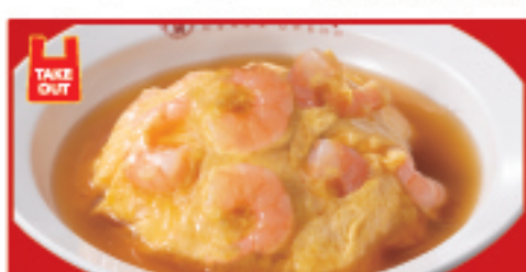
エビ玉天津飯 680円(税込)