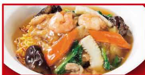
広東あんかけ焼きそば 760円