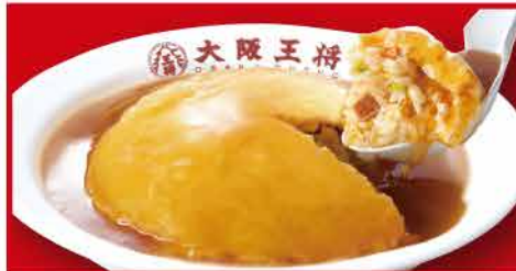
ふわとろ天津炒飯 740円