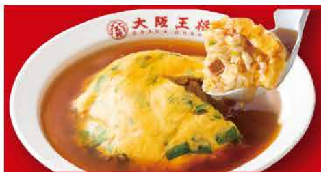
ニラ玉天津炒飯 760円