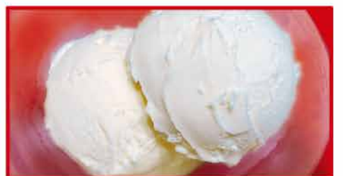
アイスクリーム 150円