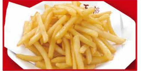
フライドポテト 310円