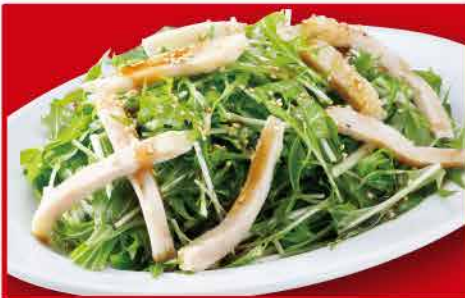
蒸し鶏の和風サラダ 440円