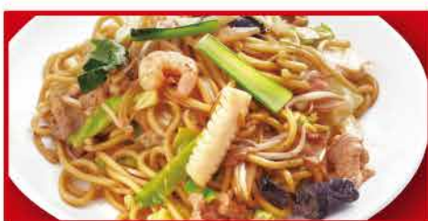
もちもち太麺の炒め焼きそば 690円