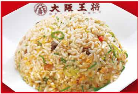
五目炒飯 500円 小 380円