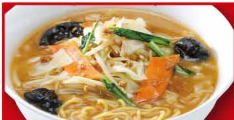
野菜たっぷり味噌ラーメン 820円