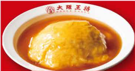
ふわとろ天津飯 500円