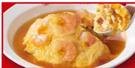
エビ玉天津炒飯 780円