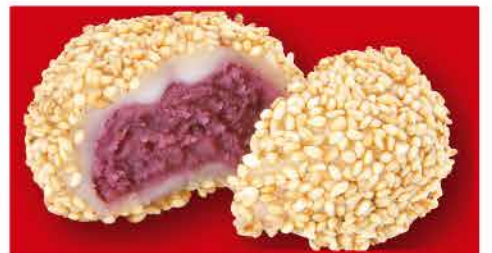
紫芋のゴマ団子 300円