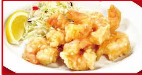
小海老の天ぷら(6尾) 610円