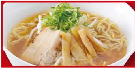
醤油ラーメン 530円 ハーフ400円