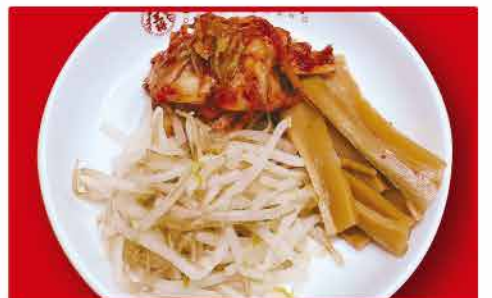
おつまみ三種盛 290円 (もやしナムル・メンマ・キムチ)