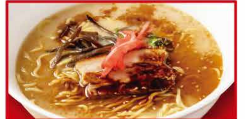
黒とんこつラーメン 640円