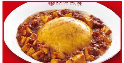
ふわとろ麻婆天津飯 760円