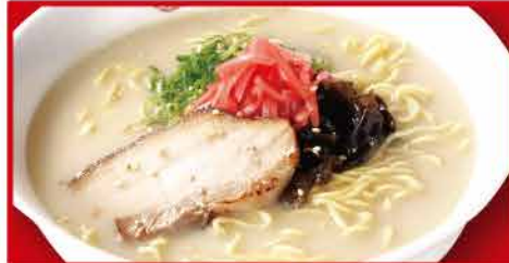
とんこつラーメン 630円