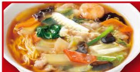
五目あんかけラーメン 810円