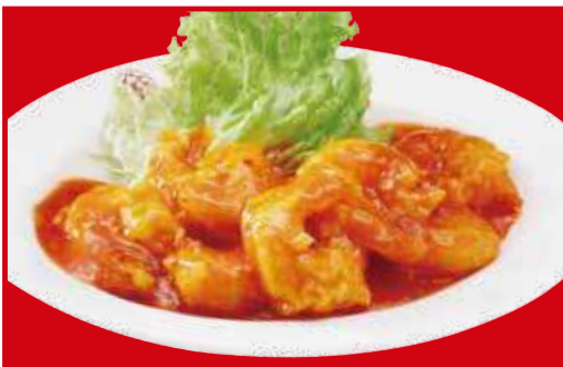
海老のチリソース