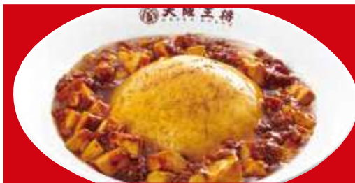
ふわとろ麻婆天津飯 税込820円