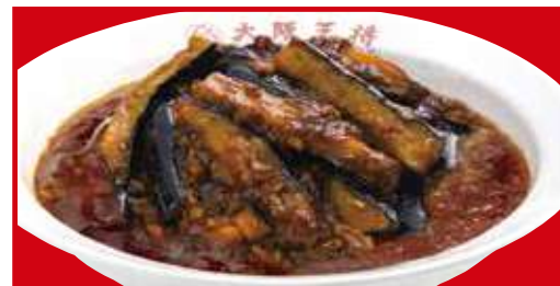
四川麻婆茄子丼 税込750円