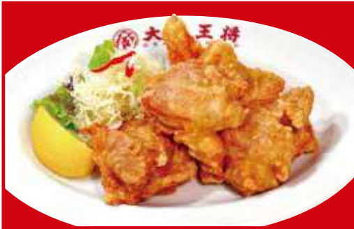
鶏の唐揚げ(5個) 税込720円