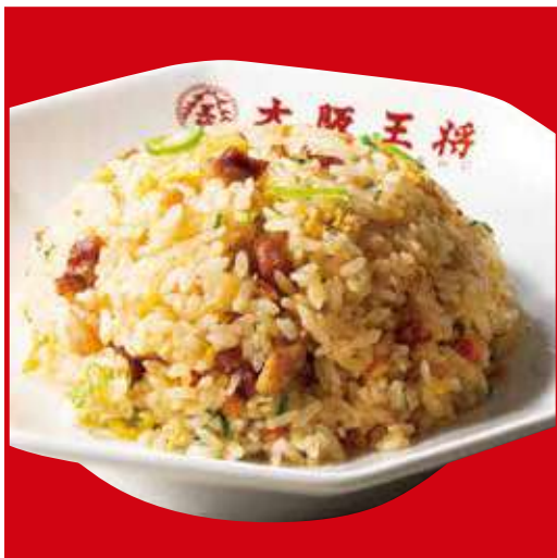
五目炒飯 税込580円 五目炒飯(ハーフ) 税込450円