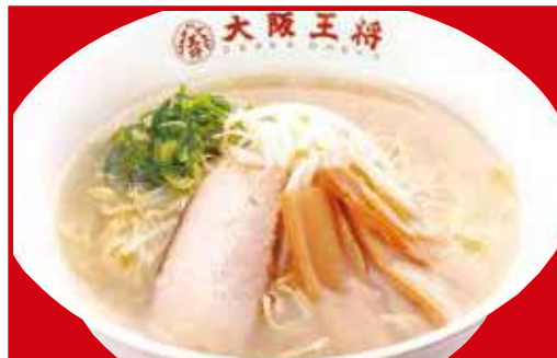
塩ラーメン 税込600円 塩ラーメン(小) 税込450円