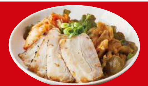
3種盛 ザーサイ・キムチ・ チャーシュー 税込630円