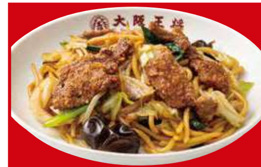
レバ入り焼きそば 税込880円

※写真はイメージです。メニューに記載の金額は総額表示になります。お持ち帰りの際には金額が異なります。