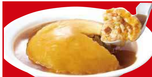
ふわとろ天津炒飯 税込800円