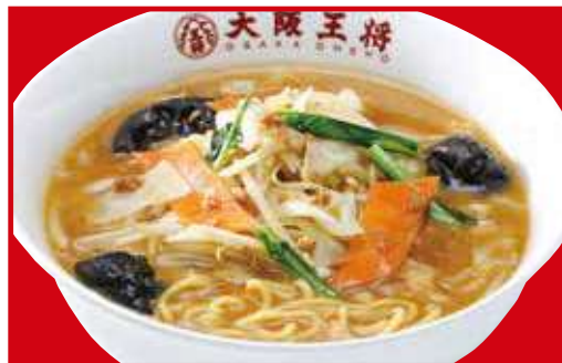
北の味噌ラーメン 税込820円