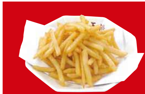
フライドポテト 税込360円