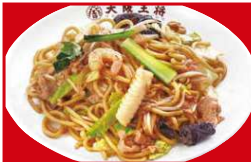
もちもち太麺の炒め焼きそば 税込680円