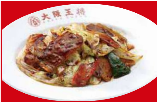
ごちそうキャベツの回鍋肉