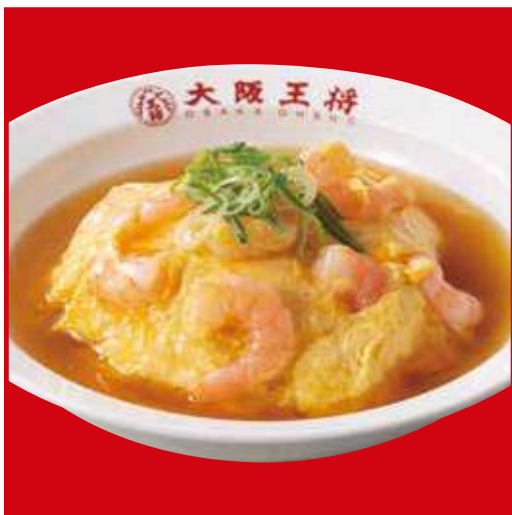
エビ玉天津飯 税込730円 エビ玉天津炒飯 税込850円