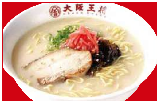
とんこつラーメン 税込650円