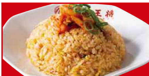
キムチ炒飯 税込700円