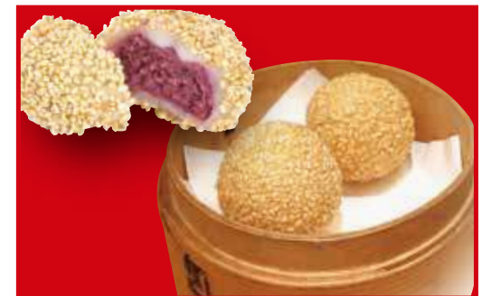
紫芋のゴマ団子(2個) 税込330円