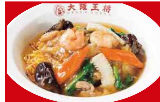
広東あんかけ焼きそば 税込820円