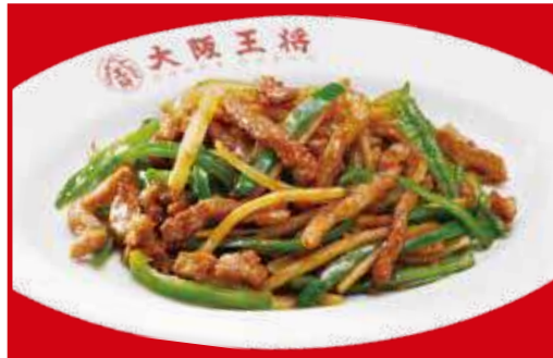
チンジャオロース