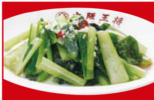
青菜ガーリック炒め