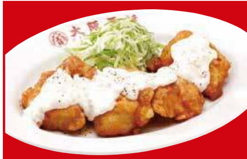
チキン南蛮(5個) 税込720円