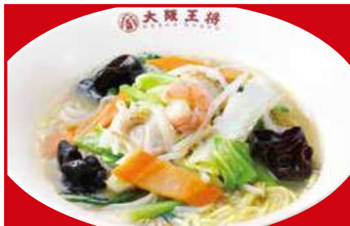
野菜タンメン 税込820円