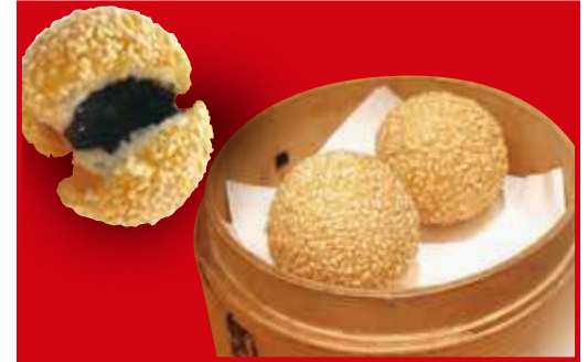
ゴマ団子(2個) 税込330円