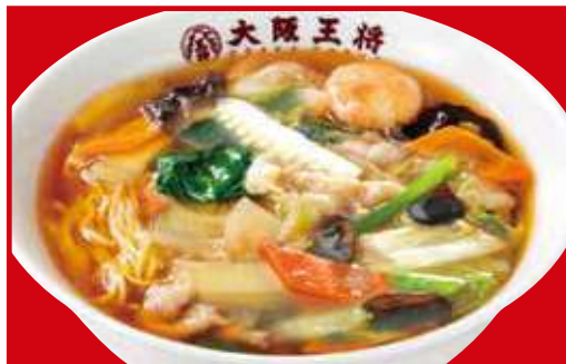
五目あんかけラーメン 税込820円