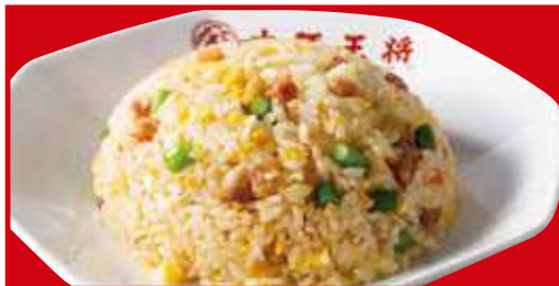
ガーリック炒飯 税込700円