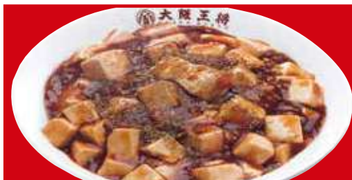
四川麻婆丼 税込700円