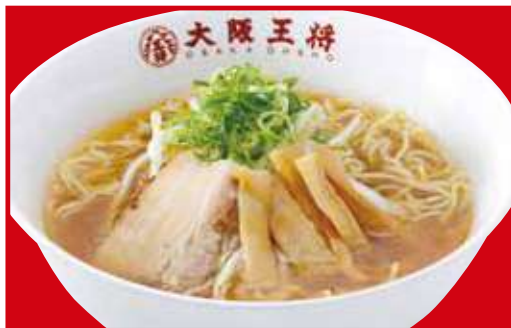
中華そば 中華そば(小) 税込600円 税込450円