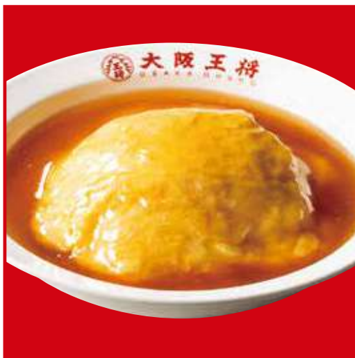
ふわとろ天津飯 税込550円