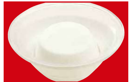
さわやか杏仁豆腐 税込330円