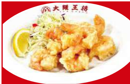
小海老の天ぷら 税込720円