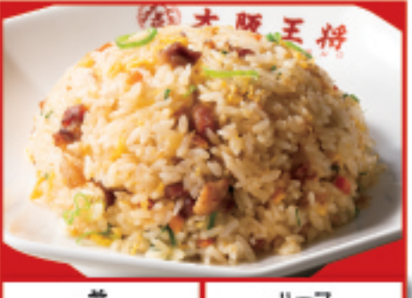
丼 580円(税込) ハーフ 450円(税込)