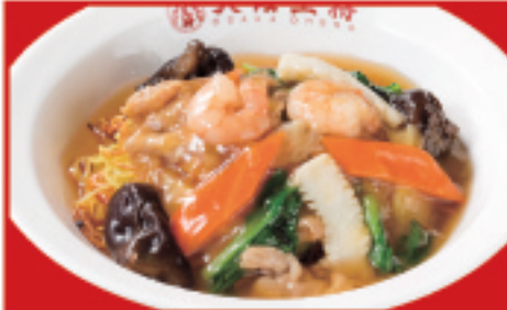
あんかけ焼きそば 900円(税込)