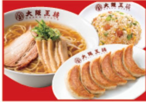
王将セット 餃子1人前・醤油ラーメン・ 五目炒飯(ハーフ) 1,300円(税込)