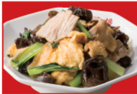
ムーシーロー 750円(税込)