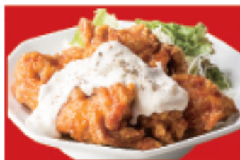
チキン南蛮 800円(税込)