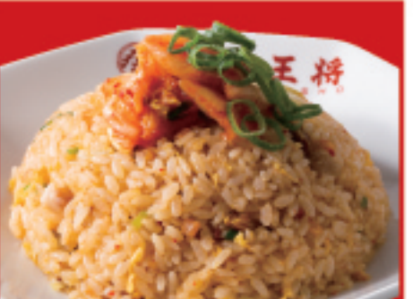
キムチ炒飯 700円(税込)