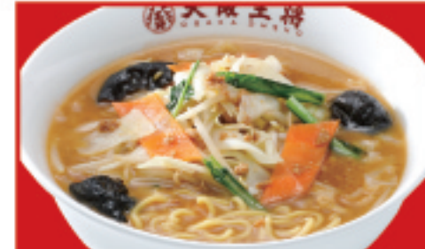
味噌ラーメン 900円(税込)