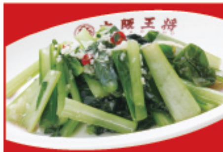
青菜ガーリック炒め 700円(税込)