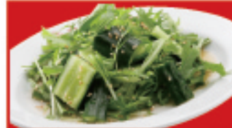
中華きゅうりサラダ 500円(税込)