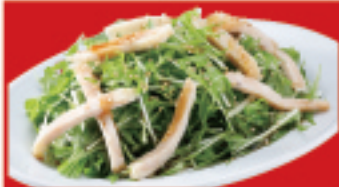
中華蒸し鶏サラダ 500円(税込)