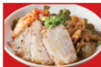
おつまみ3種盛り 700円(税込)