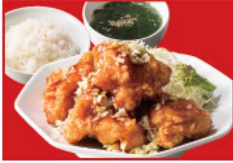
ユーリンチー定食 ユーリンチー・ご飯・ スープ 990円(税込)