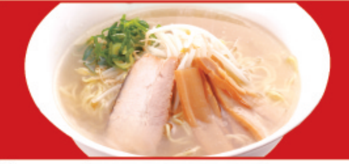
塩ラーメン 650円(税込) 塩ラーメン(ハーフ) 450円(税込)