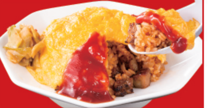
オムライス 850円(税込)