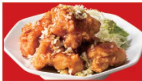
ユーリンチー 750円(税込)