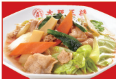
肉と野菜炒め 750円(税込)