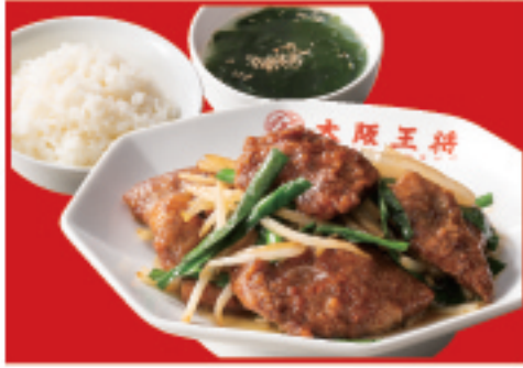
レバニラ炒め定食 レバニラ炒め・ご飯・ スープ 990円(税込)