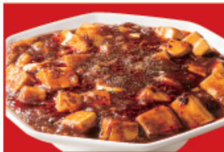
四川麻婆豆腐 700円(税込)