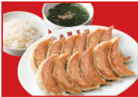
餃子定食ダブル 餃子2人前・ご飯・ スープ 900円(税込)