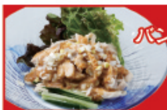
パシパンジー 600円(税込)