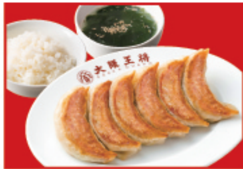
餃子定食シングル 餃子1人前・ご飯・ スープ 600円(税込)