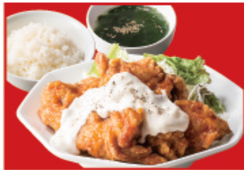
チキン南蛮定食 チキン南蛮・ご飯・ スープ 990円(税込)