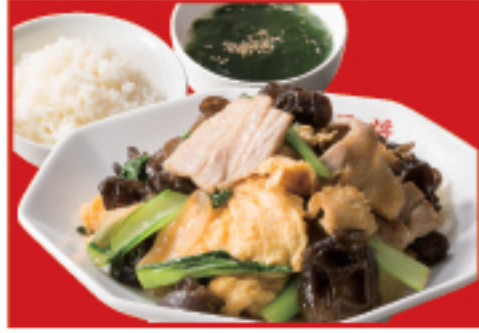
ムーシーロー定食 ムーシーロー・ご飯・ スープ 990円(税込)