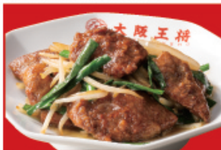
レバニラ炒め 750円(税込)