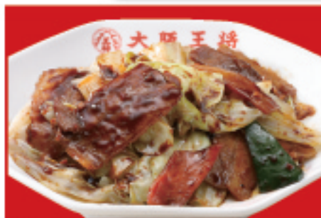
ホイコーロー 800円(税込)