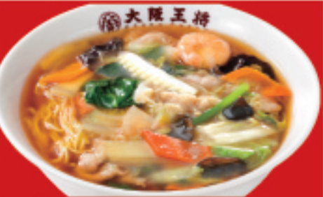
五目あんかけラーメン 850円(税込)