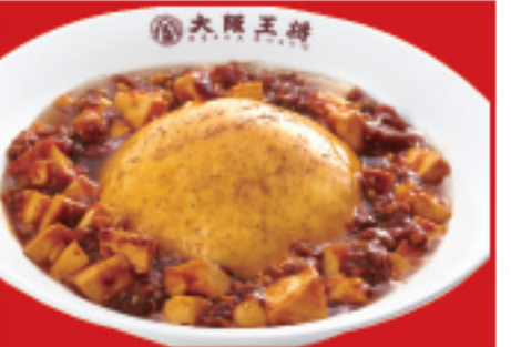
マーポー天津飯 950円(税込)