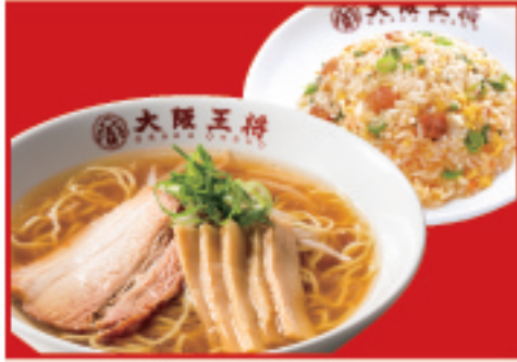
半チャンセット 醤油ラーメン・ 五目炒飯(ハーフ) 1,000円(税込)