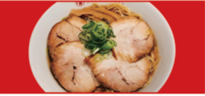
醤油チャーシュー麺 900円(税込)