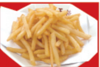
フライドポテト 500円(税込)