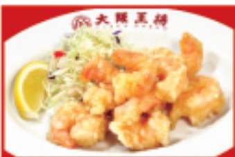
小海老の天ぷら 750円(税込)