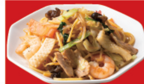
炒め焼きそば 850円(税込)