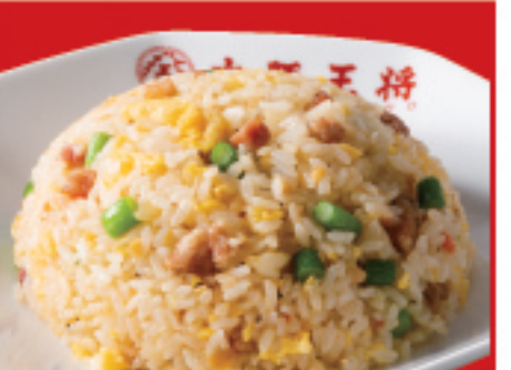
ガーリック炒飯 700円(税込)