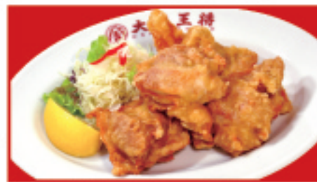
鶏の唐揚げ 750円(税込) 鶏の唐揚げ(2個) 400円(税込)