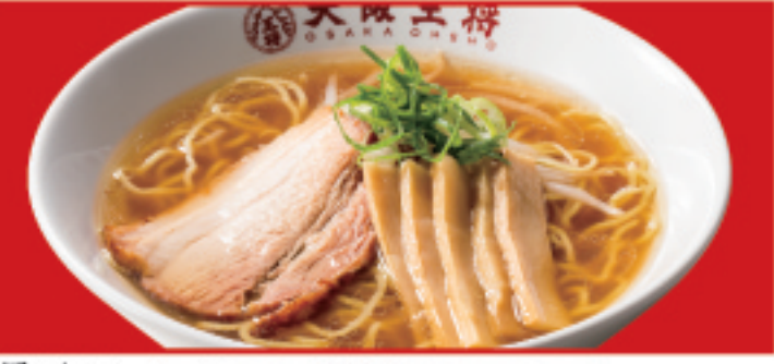
醤油ラーメン 650円(税込) 醤油ラーメン(ハーフ) 450円(税込)