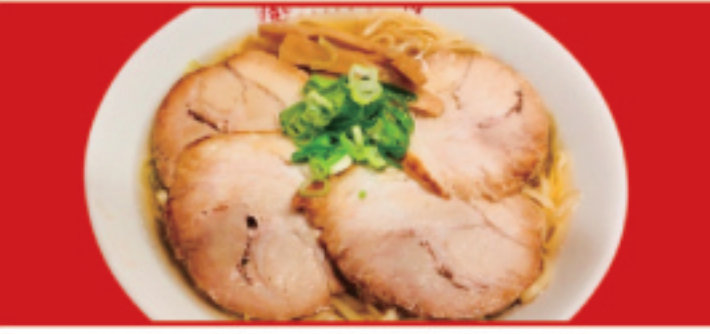
塩チャーシュー麺 900円(税込)