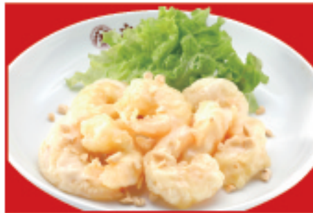
海老マヨネーズ 800円(税込)