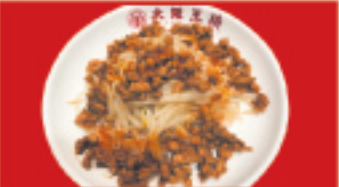
肉味噌もやし 500円(税込)