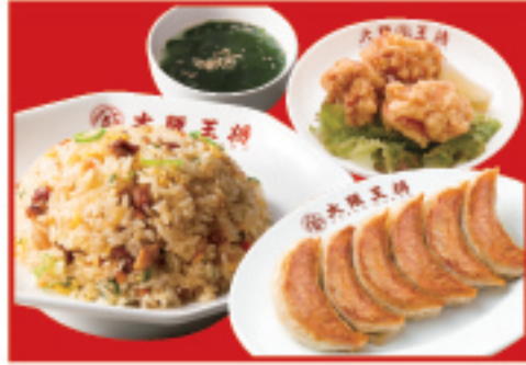
調布セット 餃子1人前・五目炒飯・ 唐揚げ3個・スープ 1,300円(税込)