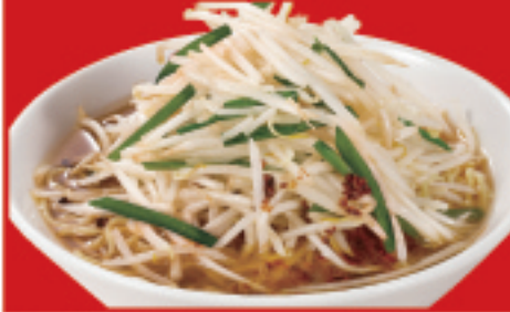
もやしそば 800円(税込)