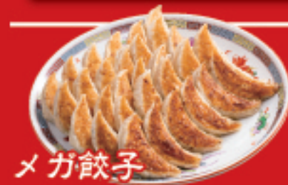
メガ餃子 30個 1,530円(税込)