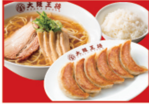
餃子麺定食 餃子1人前・ 醤油ラーメン・ご飯 1,100円(税込)