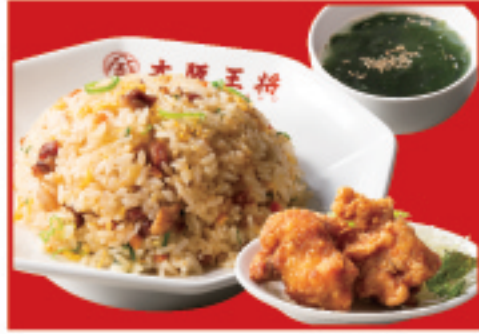
唐揚げ炒飯セット 五目炒飯・唐揚げ2個・ スープ 950円(税込)