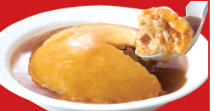
ふわとろ天津炒飯 850円(税込)