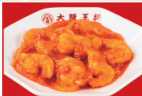
海老のチリソース 850円(税込)