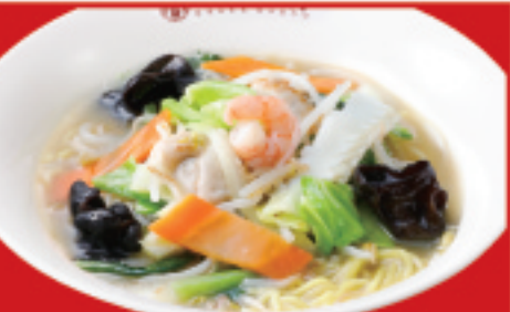
野菜タンメン 900円(税込)