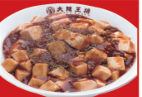
四川麻婆丼 800円(税込)