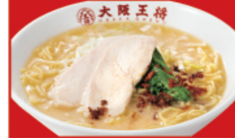
鶏白湯ラーメン 850円(税込)