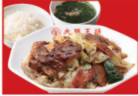
ホイコーロー定食 ホイコーロー・ご飯・ スープ 990円(税込)