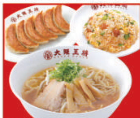
王将セット 1,260円(税込)