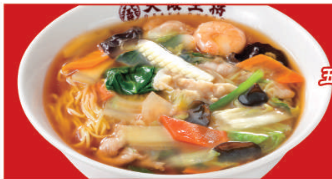
五目あんかけ ラーメン 830円(税込)