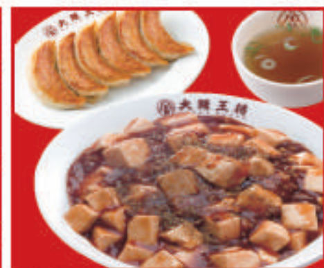
麻婆丼セット 990円(税込)