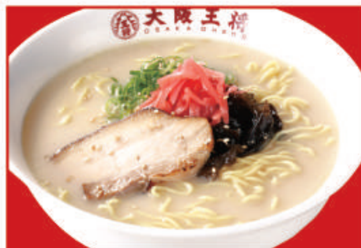
とんこつラーメン 690円(税込)