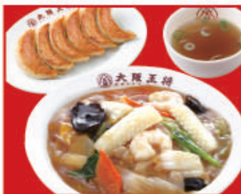
中華丼セット 990円(税込)