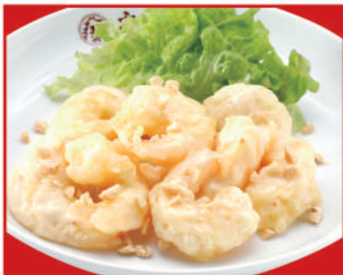
海老マヨネーズ 780円(税込)