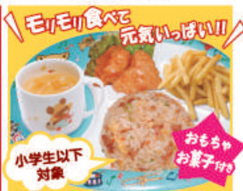
キッズプレート 600円(税込)