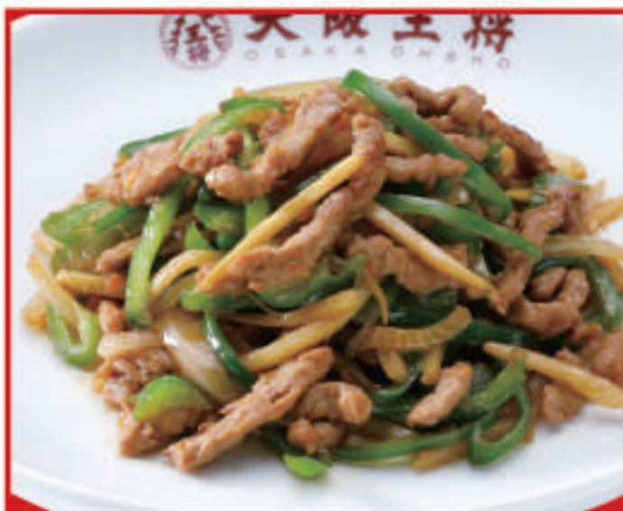
チンジャオロース 810円(税込)