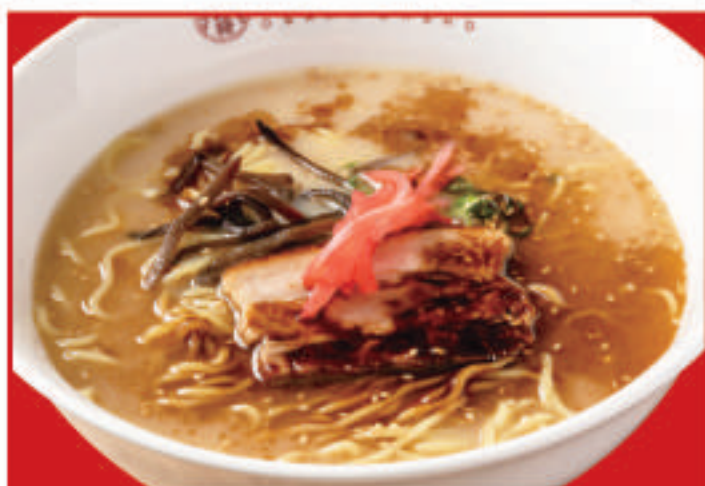
黒とんこつラーメン 710円(税込)