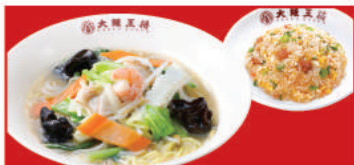
ちゃんぽんセット 1,200円(税込)