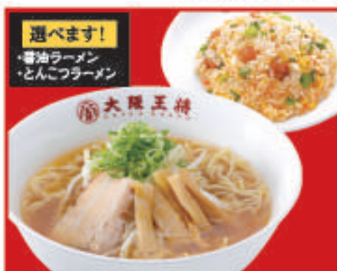
半チャンセット 990円(税込)