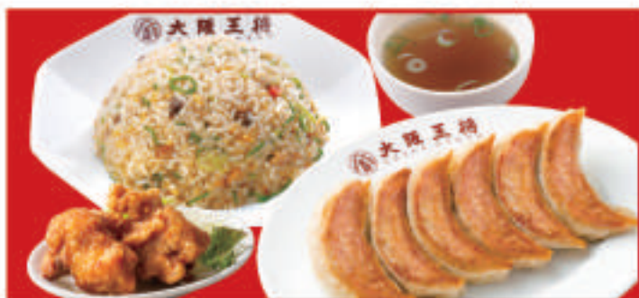
餃子セットシングル 1,170円(税込)