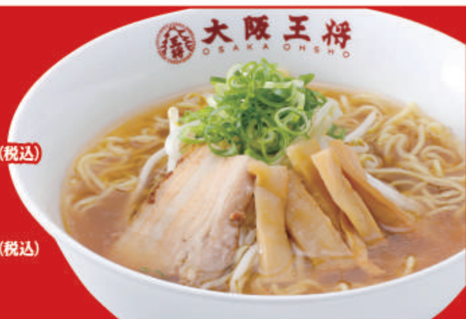
醤油ラーメン 630円(税込)