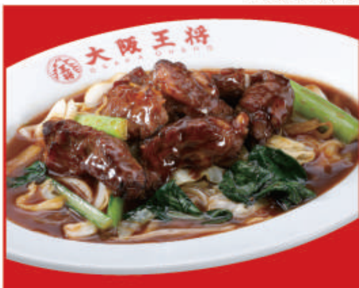
牛カルビ炒め 840円(税込)