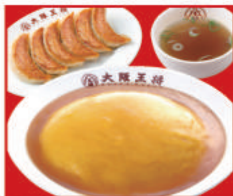
天津飯セット 800円(税込)