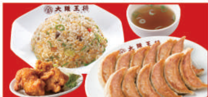
餃子セットダブル 1,460円(税込)