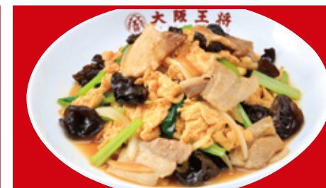
ムーシーロー 700円(税込)