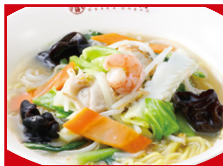
大阪チャンポン 820円(税込)