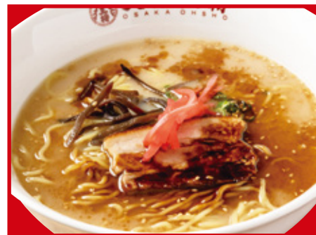
黒とんこつラーメン 680円(税込)