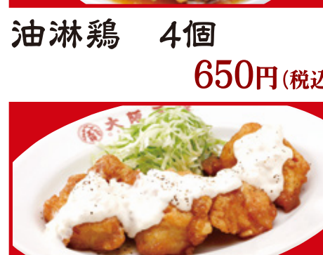
油淋鶏 4個 650円(税込)