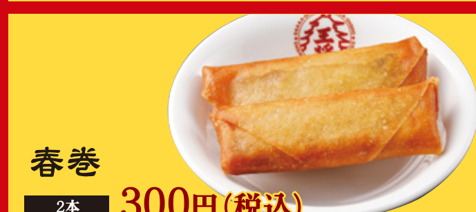
春巻 2本 300円(税込)