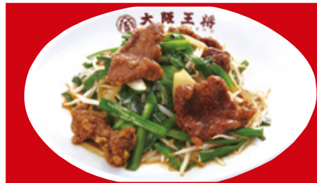
レバニラ炒め 780円(税込)