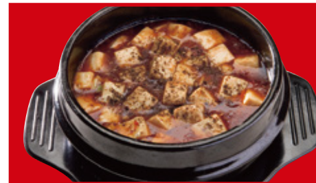
四川麻婆豆腐 780円(税込)