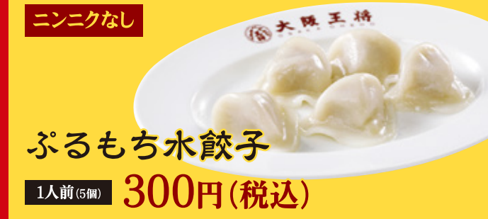
ぷるもち水餃子 1人前(5個) 300円(税込)