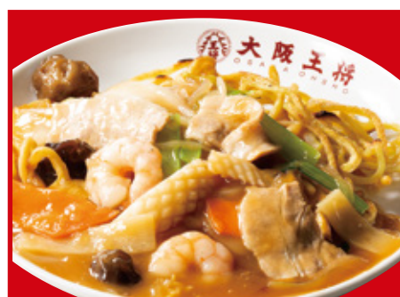
五目あんかけ焼きそば 820円(税込)