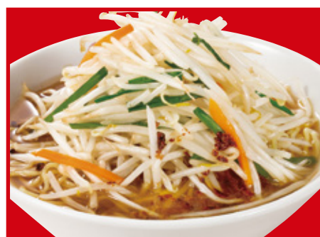
もやしそば 720円(税込)