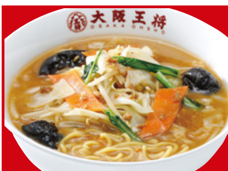
野菜たっぷり味噌ラーメン 820円(税込)