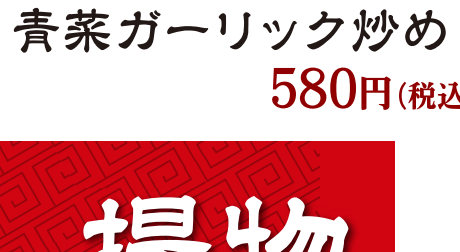
青菜ガーリック炒め 580円(税込)