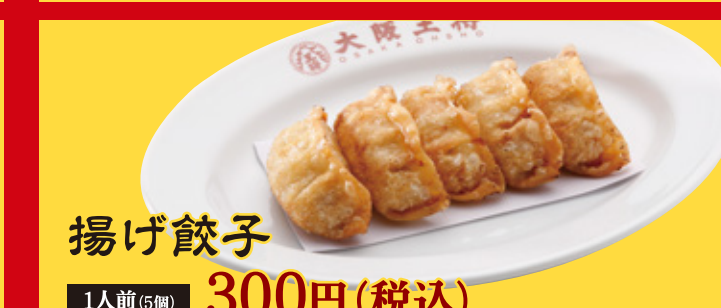
揚げ餃子 1人前(5個) 300円(税込)