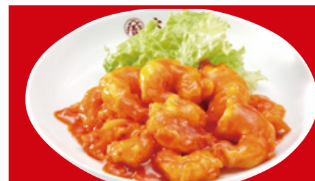
海老のチリソース 920円(税込)