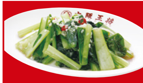
青菜ガーリック炒め 580円(税込)