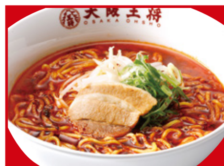
炎のラーメン 750円(税込)