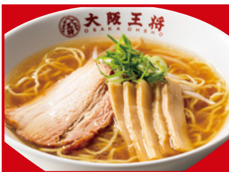
中華そば 600円(税込) 中華そば(小) 430円(税込)