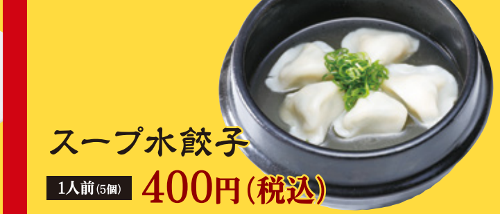
スープ水餃子 1人前(5個) 400円(税込)