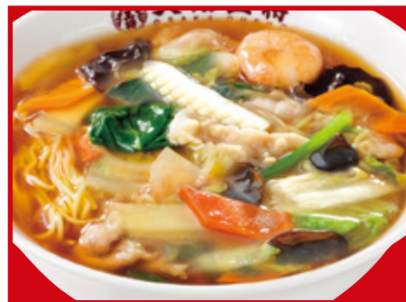
五目あんかけラーメン 820円(税込)