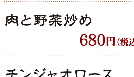
肉と野菜炒め 680円(税込)