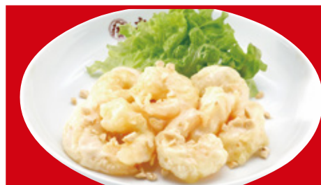
海老マヨネーズ 800円(税込)