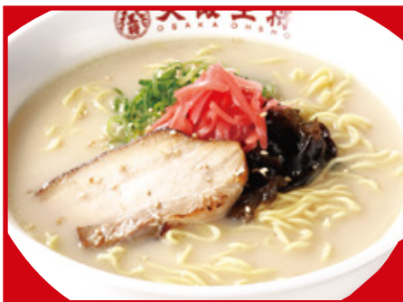
とんこつラーメン 650円(税込)