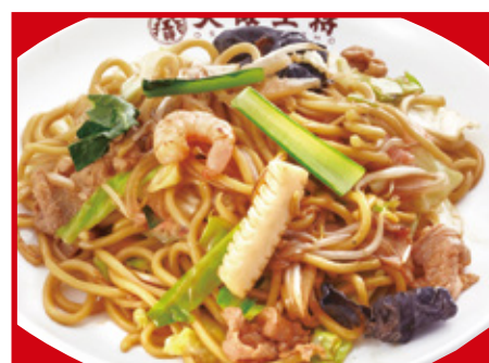
もちもち太麺の炒め焼きそば 690円(税込)