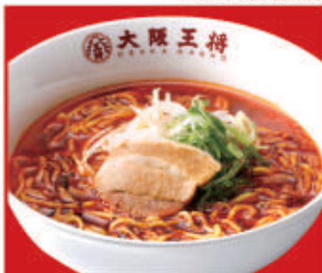
炎のラーメン 730円(税込)