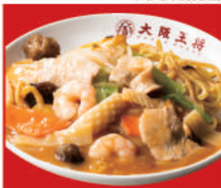
広東あんかけ焼きそば 820円(税込)