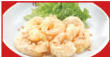
海老マヨネーズ 800円(税込)