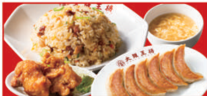
餃子セット 1,040円(税込)