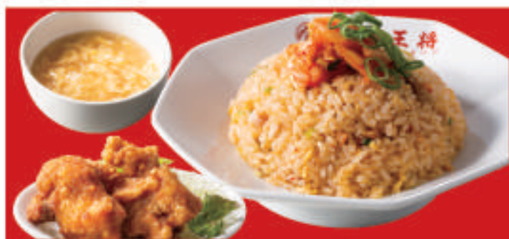
唐揚げ&キムチ炒飯セット 900円(税込)