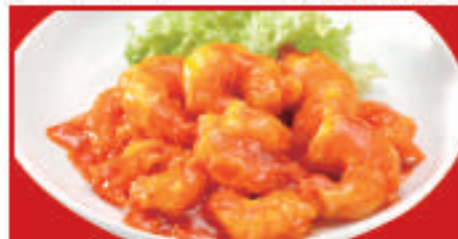
海老のチリソース 850円(税込)