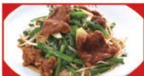
レバニラ炒め 750円(税込)