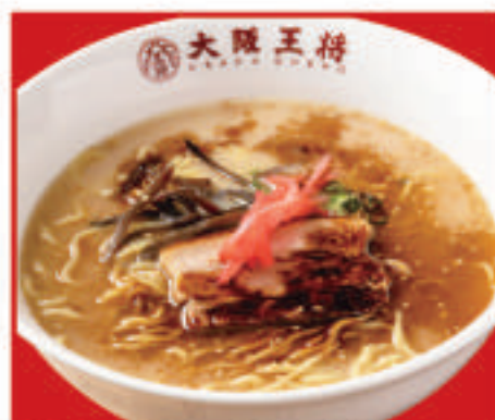
黒とんこつラーメン 660円(税込)