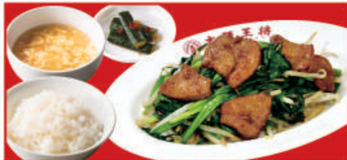
レバニラ定食 レバニラ炒め・ご飯・スープ・漬物