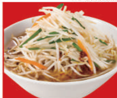
もやしそば 700円(税込)