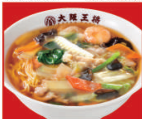
五目あんかけラーメン 820円(税込)