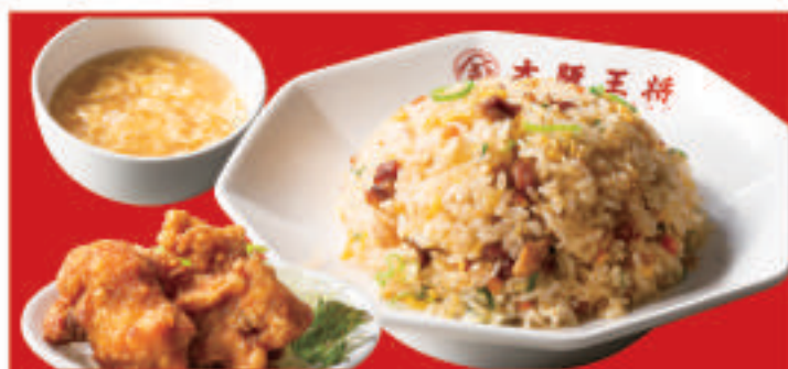
唐揚げ&炒飯セット 800円(税込)