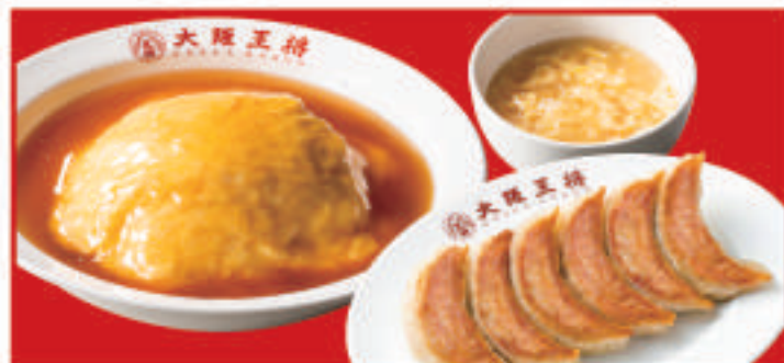
餃子&天津飯セット 790円(税込)