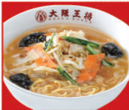
味噌ラーメン 830円(税込)