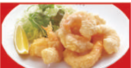
海老の天ぷら 700円(税込)