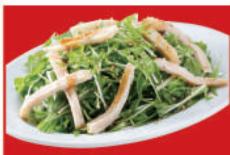
蒸し鶏の和風サラダ 500円(税込)