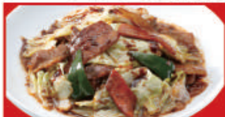
ごちそうキャベツの回鍋肉 750円(税込)