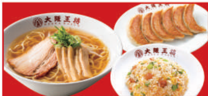
王将セット 1,260円(税込)