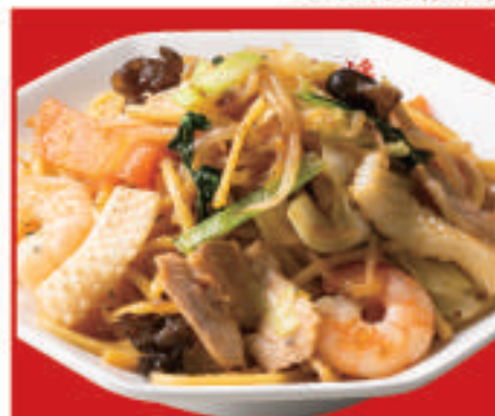
もちもち太麺の炒め焼きそば 700円(税込)