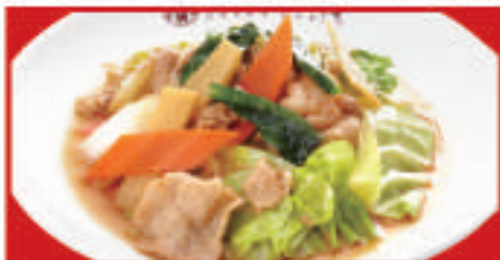
肉と野菜炒め 650円(税込)