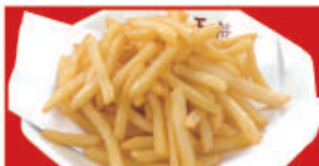
フライドポテト 330円(税込)