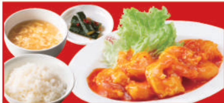
海老チリ定食 海老のチリソースハーフ・ご飯・スープ・漬物