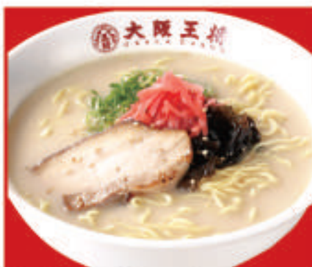
とんこつラーメン 620円(税込)