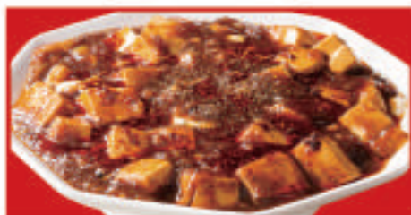
皇麻婆豆腐 750円(税込)