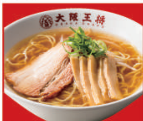
中華そば 580円(税込) 中華そば(ハーフ) 410円(税込)