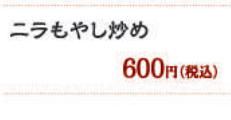
ニラもやし炒め 600円(税込)