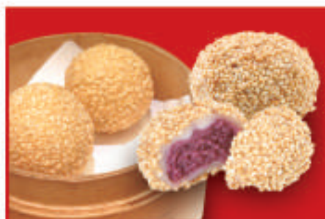
紫芋のゴマ団子 300円(税込)