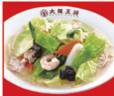
野菜ちゃんぽん 830円(税込)