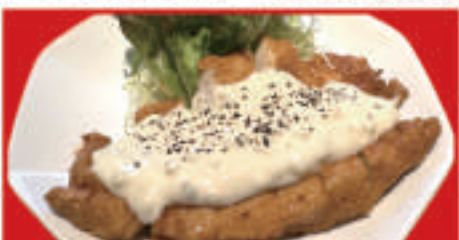
チキン南蛮 640円(税込)