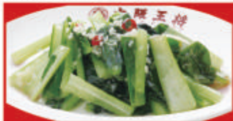
青菜ガーリック炒め 540円(税込)