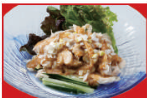
バンバンジー 500円(税込)