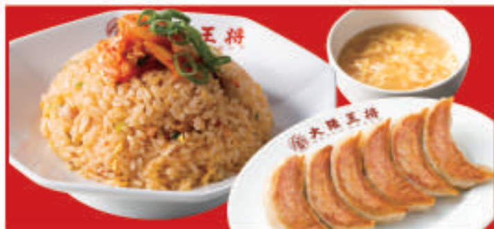
餃子&キムチ炒飯セット 960円(税込)