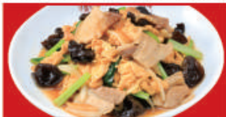
ムーシーロー 700円(税込)