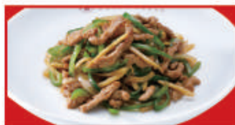
チンジャオロース 750円(税込)