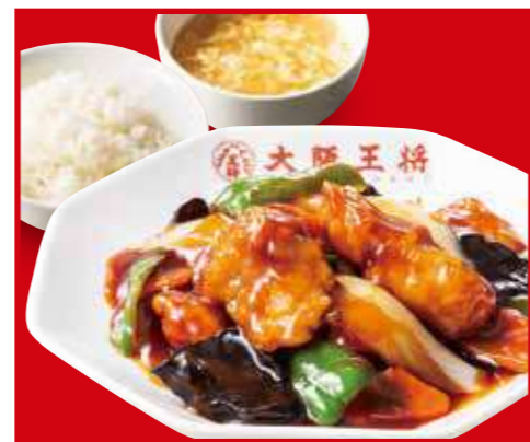
酢豚定食 酢豚、ご飯、スープ 1,100円 (税込)