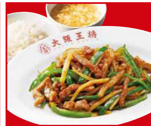
チンジャオロース定食 チンジャオロース、ご飯、スープ 1,100円 (税込)