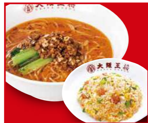
担々麺半チャンセット 担々麺、五目炒飯(小) 1,100円 (税込)