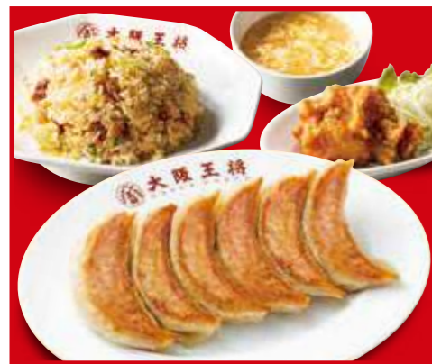
餃子&炒飯定食 餃子1人前、五目炒飯、唐揚げ1個、スープ 1,050円 (税込)