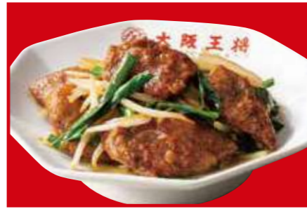
レバニラ炒め 830円 (税込)