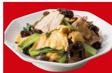
ムーシーロー 890円 (税込)