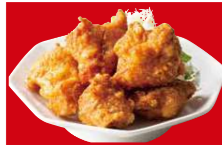
鶏の唐揚げ 790円 (税込)