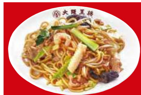
炒め焼きそば 790円(税込)