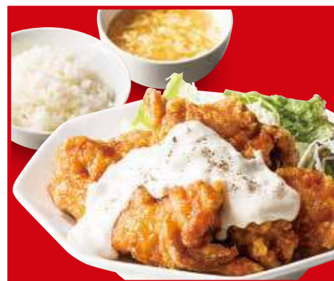
チキン南蛮定食 チキン南蛮、ご飯、スープ 1,030円 (税込)