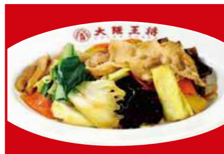
肉と野菜炒め 890円 (税込)