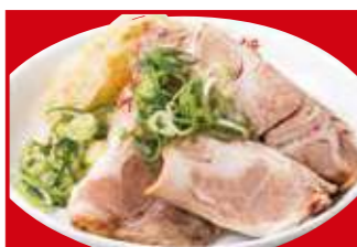
チャーシュー 590円(税込)