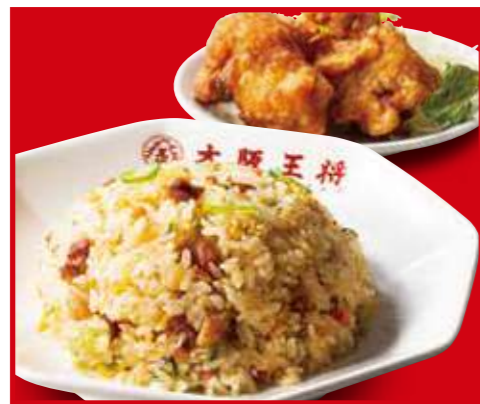
唐揚げ&炒飯定食 五目炒飯、唐揚げ2個 990円 (税込)