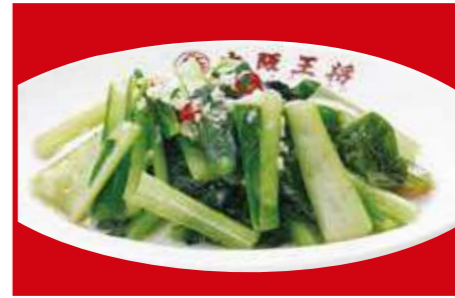
青菜ガーリック炒め 790円 (税込)