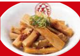
旨いめんま 390円(税込)