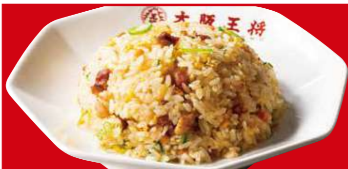
五目炒飯 680円(税込) 五目炒飯(小) 500円(税込)