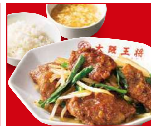
レバニラ炒め定食 レバニラ炒め、ご飯、スープ 990円 (税込)