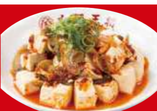
中華やっこ 390円(税込)