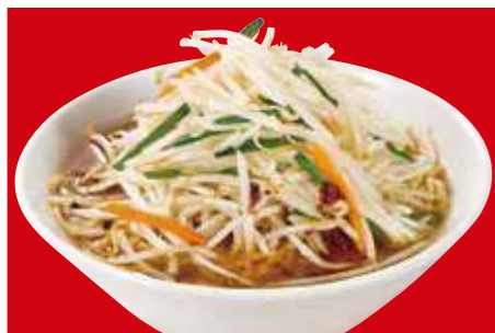
もやしそば 790円(税込)