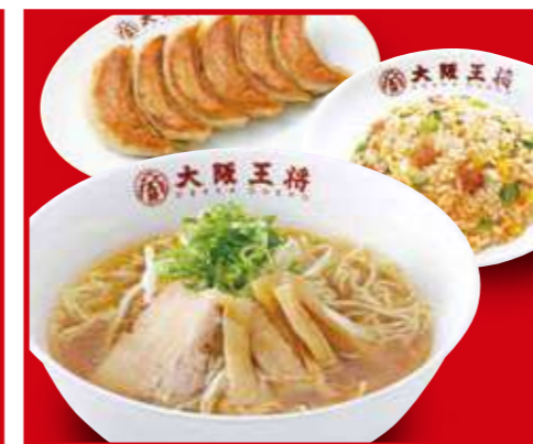
王将セット 餃子1人前、中華そば、五目炒飯(小) 1,290円 (税込)