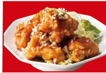
油淋鶏 890円 (税込)