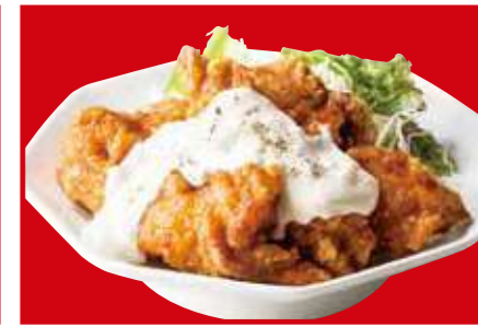
チキン南蛮 920円 (税込)