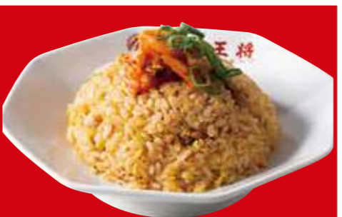
キムチ炒飯 790円(税込)