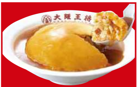
ふわとろ天津炒飯 800円(税込)