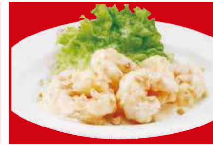
海老のマヨネーズ 890円 (税込)