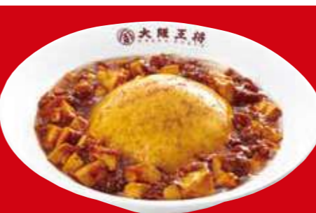
マーボー天津飯 830円(税込)