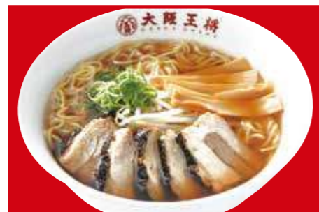
チャーシュー麺 1,100円(税込)