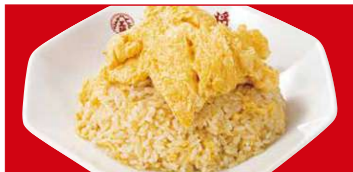
玉子たっぷり炒飯 730円(税込)