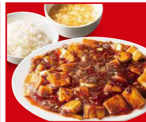
四川麻婆豆腐定食 麻婆豆腐、ご飯、スープ 990円 (税込)