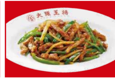
チンジャオロース 1,030円 (税込)