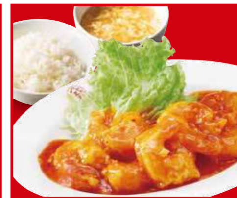
海老のチリソース定食 海老のチリソース、ご飯、スープ 1,100円 (税込)