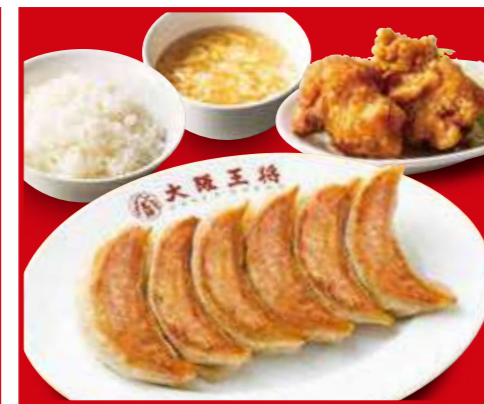
餃子定食シングル 餃子1人前、ご飯、スープ、唐揚げ2個 890円 (税込)