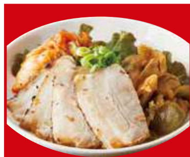
おつまみ3種盛り ザーサイ・キムチ・チャーシュー 680円(税込)