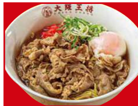
牛バラ肉吸い醤油ラーメン 890円(税込)