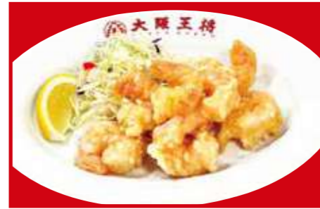
小エビの天ぷら 780円 (税込)