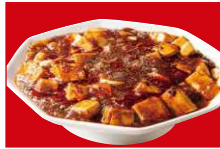
四川麻婆豆腐 890円 (税込)