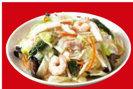
海鮮皿うどん 890円(税込)