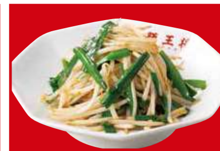
ニラもやし炒め 790円 (税込)