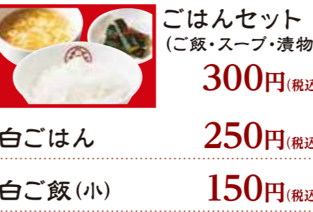
ごはんセット (ご飯・スープ・漬物) 300円(税込) 白ごはん 250円(税込) 白ご飯(小) 150円(税込)