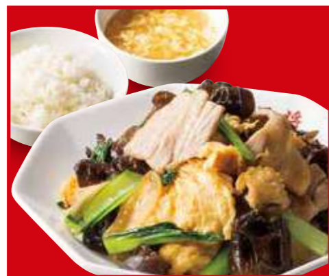
ムーシーロー定食 ムーシーロー、ご飯、スープ 990円 (税込)