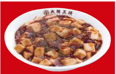
四川麻婆丼 780円(税込)