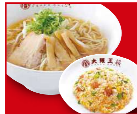
半チャンセット 中華そば、五目炒飯(小) 990円 (税込)