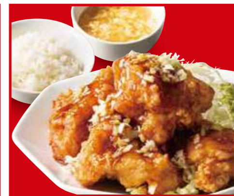
油淋鶏定食 油淋鶏、ご飯、スープ 1,030円 (税込)