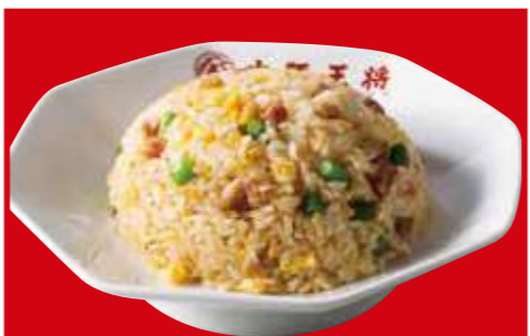
ニンニク炒飯 790円(税込)