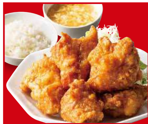
鶏の唐揚げ定食 鶏のから揚げ、ご飯、スープ 990円 (税込)