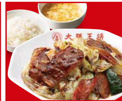
ホイコーロー定食 ホイコーロー、ご飯、スープ 990円 (税込)