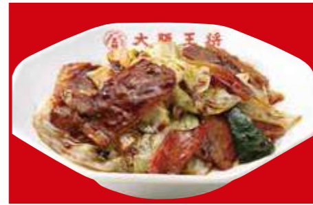
ホイコーロー 890円 (税込)