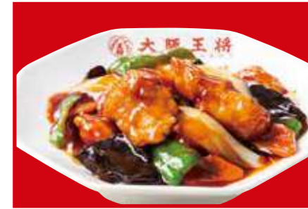
酢豚 1,030円 (税込)