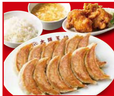
餃子定食 餃子2人前、ご飯、スープ、唐揚げ2個 1,180円 (税込)