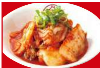
うまいキムチ 390円(税込)