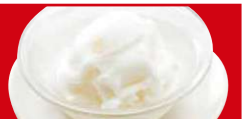
シャーベット 390円(税込)