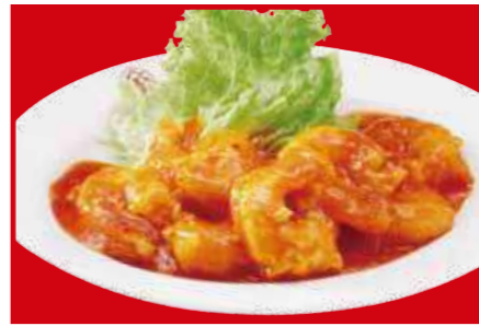
海老のチリソース 1,030円 (税込)