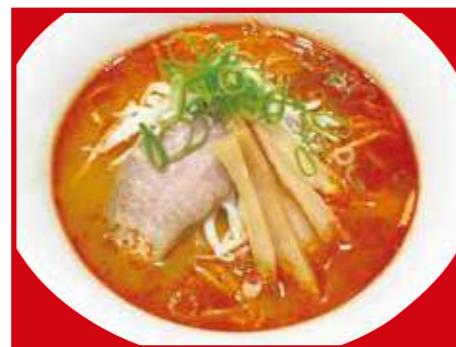
赤玉ラーメン 890円(税込)