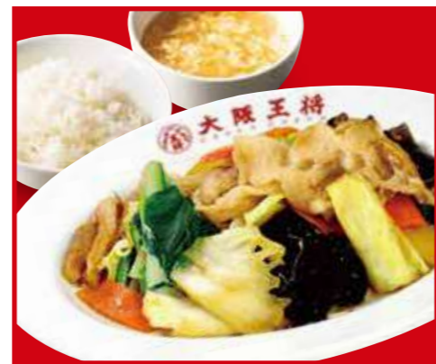
肉と野菜炒め定食 肉と野菜炒め、ご飯、スープ 930円 (税込)