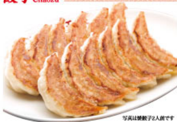
写真は焼餃子2人前です