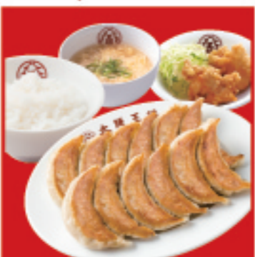
餃子定食 ・餃子2人前・唐揚げ2ヶ・白ご飯・スープ 990円 税込