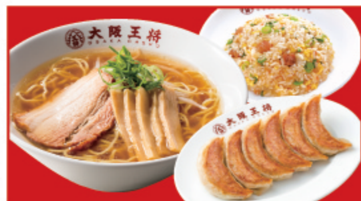
王将セット ・餃子1人前・中華そば・五目炒飯(小) 1,270円 税込