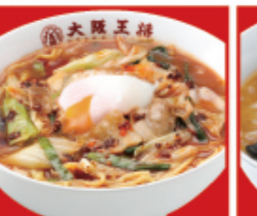
創業スタメン 890円 税込