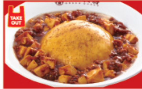
ふわとろ麻婆天津飯 880円 税込