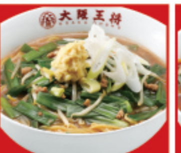
葱生姜味噌ラーメン 880円 税込