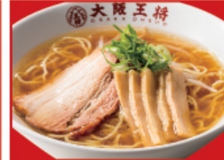
中華そば 590円 税込 中華そば(ハーフ) 420円 税込