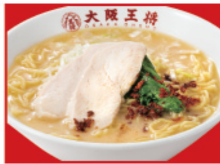
鶏白湯ラーメン 670円 税込