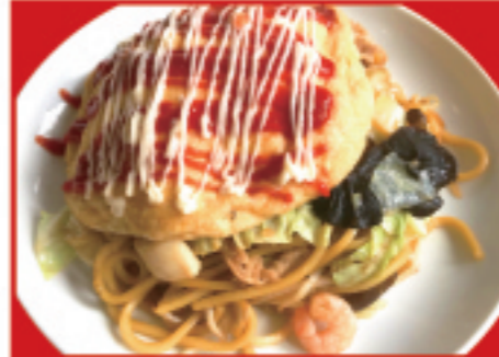
オムそば 720円 税込