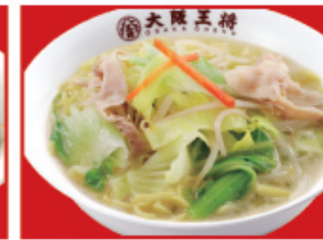
野菜タンメン 850円 税込