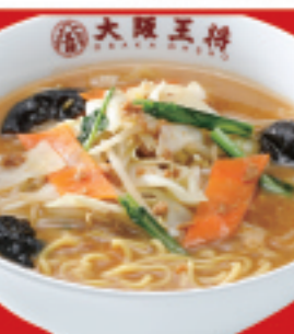
野菜たっぷり味噌ラーメン 850円 税込