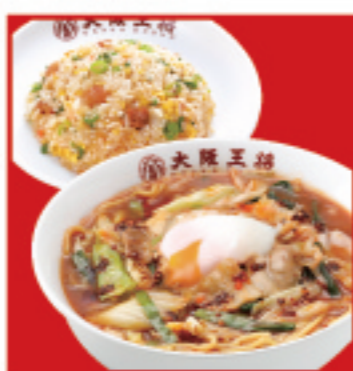
創業スタメン & 半炒飯セット ・創業スタメン・ハーフ五目炒飯 1,270円 税込