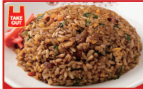
黒炒飯 680円 税込