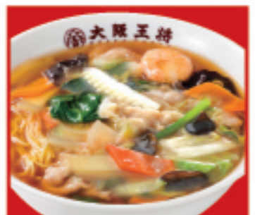
五目あんかけラーメン 800円 税込