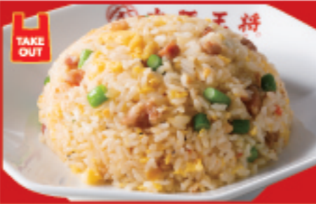
ニンニク炒飯 730円 税込