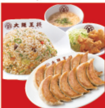
餃子セット ダブル ・餃子2人前・五目炒飯・唐揚げ2ヶ・スープ 1,310円 税込