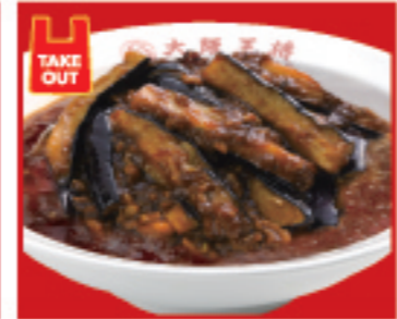
四川麻婆茄子丼 730円 税込