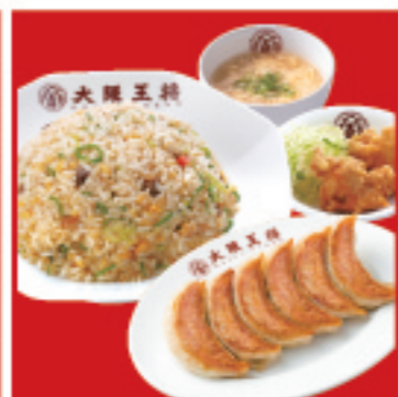
餃子セット シングル ・餃子1人前・五目炒飯・唐揚げ2ヶ・スープ 1,020円 税込