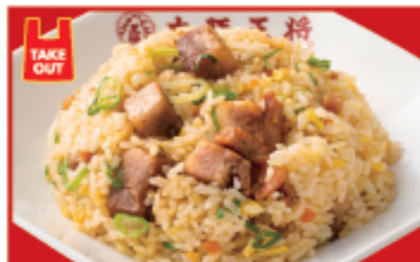
焼豚炒飯 850円 税込