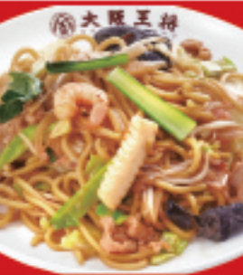
もちもち太麺の炒め焼きそば 750円 税込