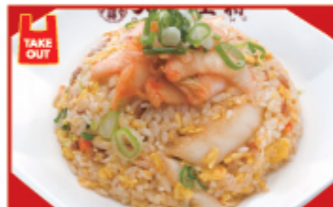
牛ムチ炒飯 750円 税込