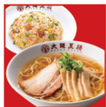
中華そば & 半炒飯セット ・中華そば・ハーフ五目炒飯 970円 税込