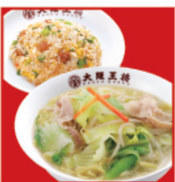
野菜タンメン & 半炒飯セット ・野菜タンメン・ハーフ五目炒飯 1,230円 税込