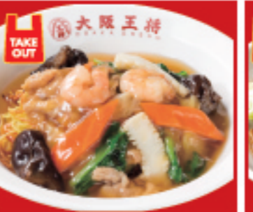
広東あんかけ焼きそば 820円 税込