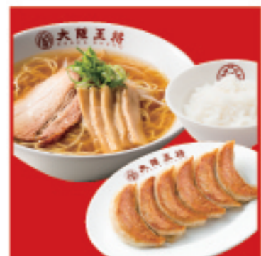
王将定食 ・餃子1人前・中華そば・白ご飯 1,020円 税込