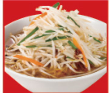
もやしそば 750円 税込