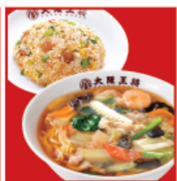
五目あんかけラーメン & 半炒飯セット ・五目あんかけラーメン・ハーフ五目炒飯 1,180円 税込