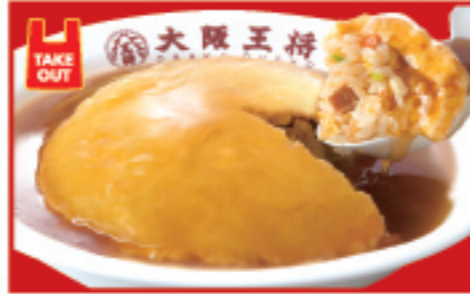
ふわとろ天津炒飯 820円 税込