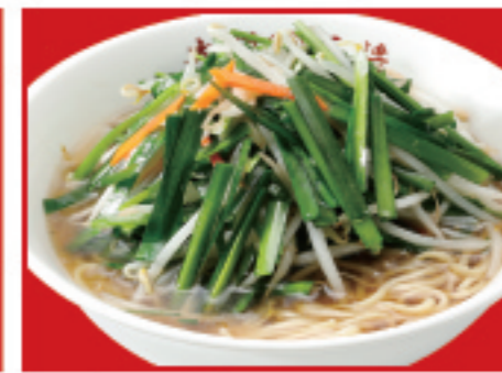
にらそば 800円 税込