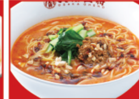
担々麺 770円 税込