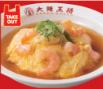
海老玉天津飯 750円 税込