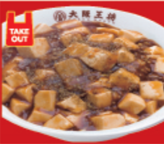
四川麻婆丼 700円 税込