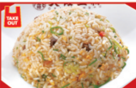
五目炒飯 560円 税込 五目炒飯(ハーフ) 400円 税込