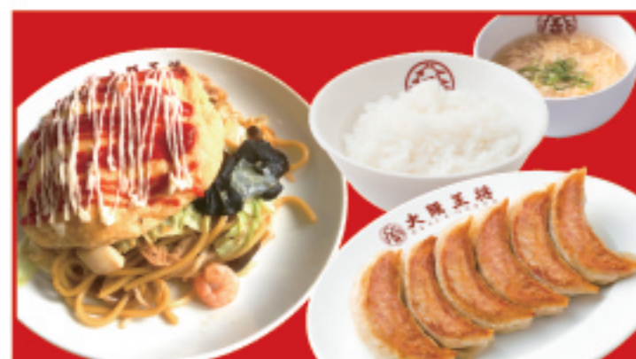
青梅限定 オムそばMAX ・オムそばロール・餃子・白ご飯・スープ 1,280円 税込