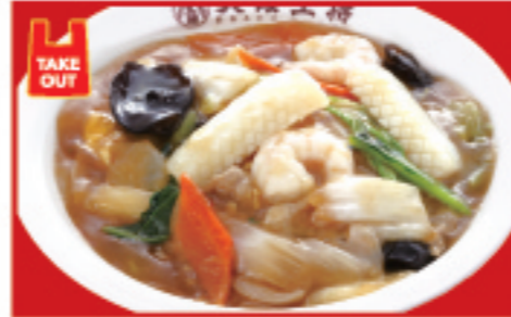
中華丼 710円 税込