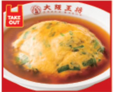
ニラ玉天津飯 680円 税込