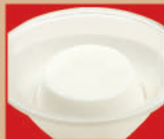
さわやか杏仁豆腐 税込310円