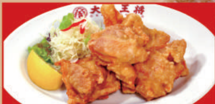
唐揚げ 5個 税込690円 唐揚げ(小) 税込430円