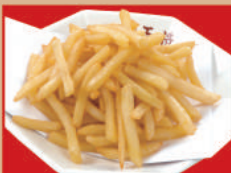
フライドポテト 税込370円