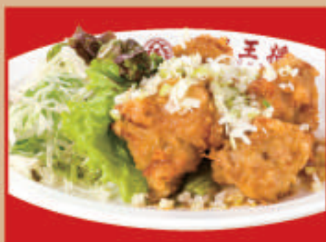
油淋鶏 4個 税込680円 油淋鶏(小) 税込420円