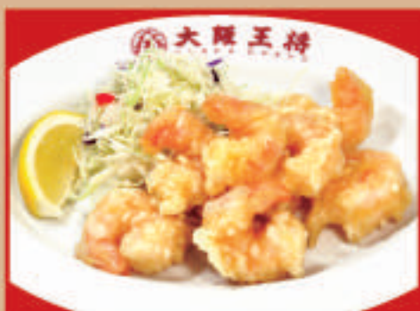
小海老の天ぷら 税込660円 小海老の天ぷら(小) 税込410円