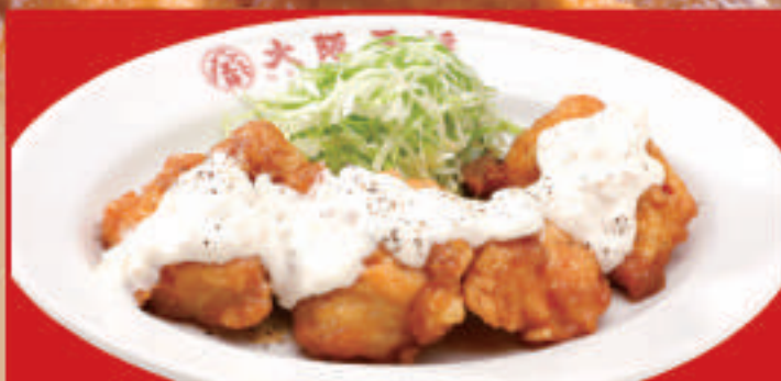
チキン南蛮 4個 税込680円 チキン南蛮(小) 税込420円