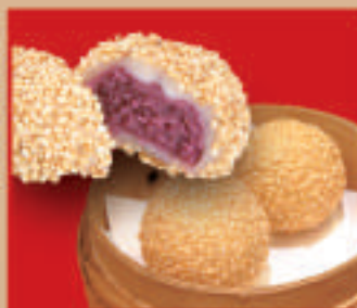
紫芋のゴマ団子 税込310円