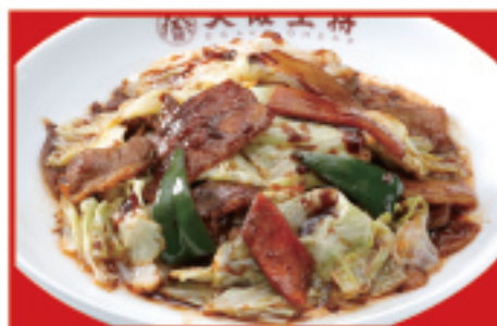
ごちそうキャベツの回鍋肉