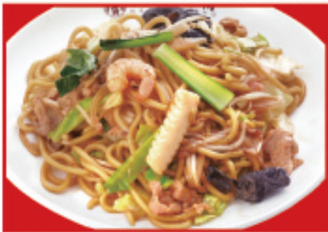
もちもち太麺の炒め焼きそば