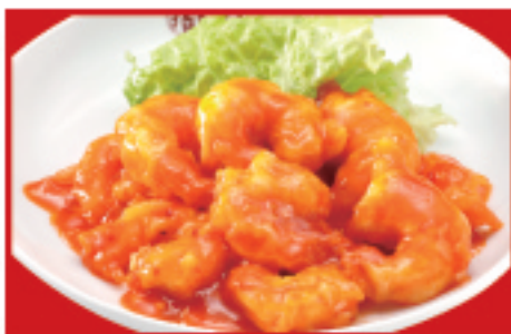
海老のチリソース