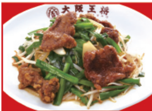
レバニラ炒め 税込760円