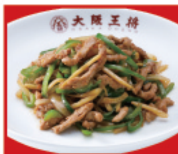
チンジャオロース