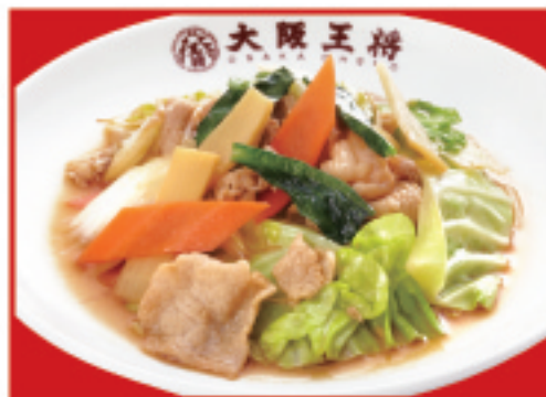
肉と野菜炒め 税込690円