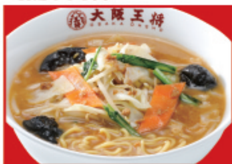
野菜たっぷり味噌ラーメン