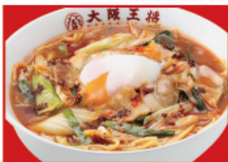
創業スタミナラーメン