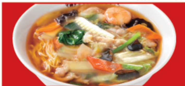
五目あんかけラーメン