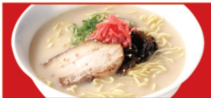
とんこつラーメン