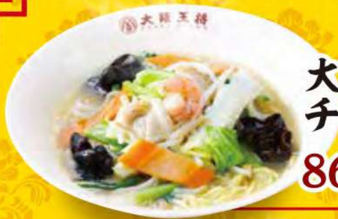
大阪風 チャンポン麺