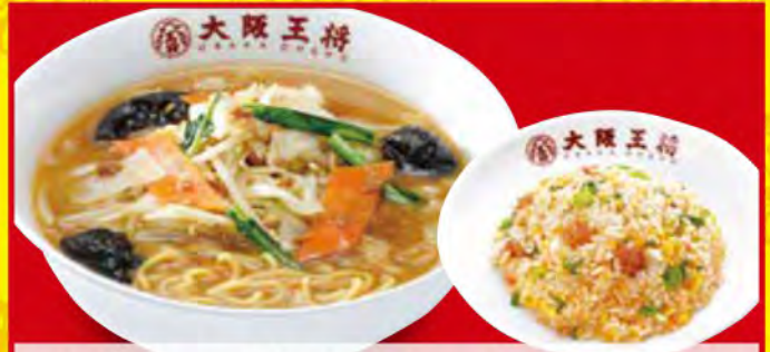
味噌ラーメンセット 1,280円 [税込] ・野菜たっぷり味噌ラーメン ・五目炒飯 (小)