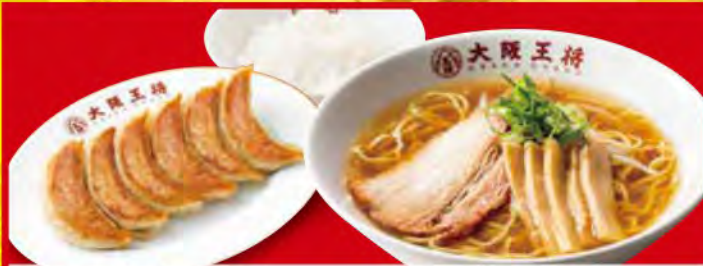
王将定食 1,120円[税込] ・醤油ラーメン ・餃子1人前 ・白ご飯