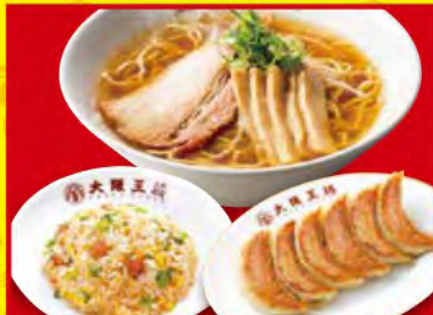
王将セット ・醤油ラーメン ・五目炒飯 (小) ・餃子1人前 1,320円 [税込]