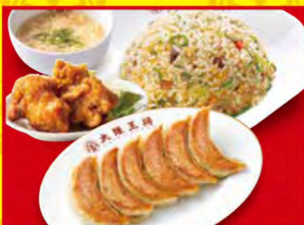
餃子セット シングル ・餃子1人前 ・五目炒飯 ・唐揚げ(2個) ・スープ 1,080円[税込]