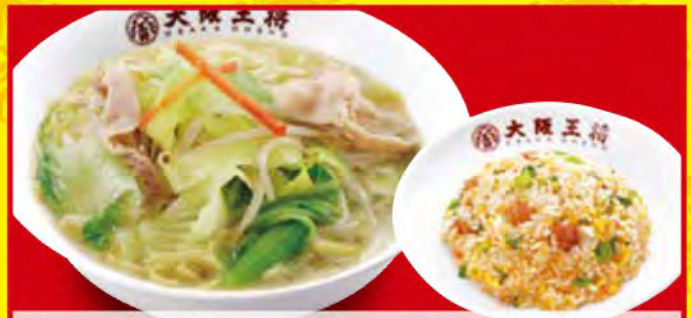
湯麺セット 1,250円 [税込] ・野菜たっぷりタンメン ・五目炒飯 (小)