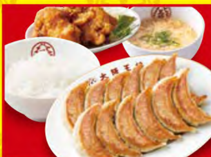
餃子定食 ・餃子2人前 ・唐揚げ(2個) ・白ご飯 ・スープ 1,020円[税込]