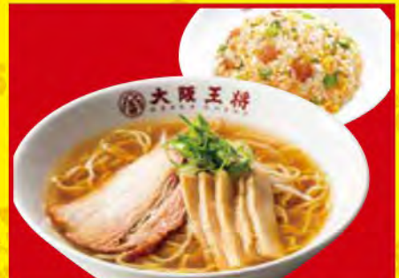
半チャンセット ・醤油ラーメン ・五目炒飯 (小) 1,050円 [税込]