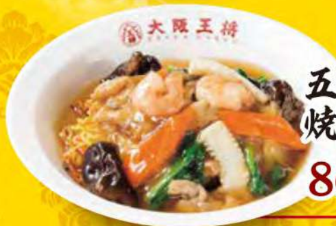
五目あんかけ 焼きそば