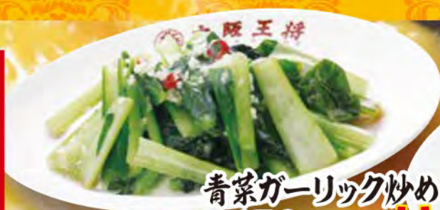
青菜ガーリック炒め