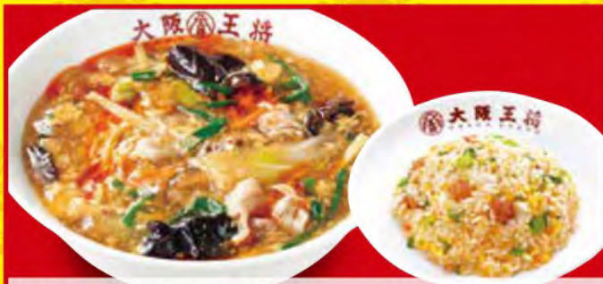
酸辣湯麺セット 1,250円 [税込] ・酸辣湯麺 ・五目炒飯 (小)