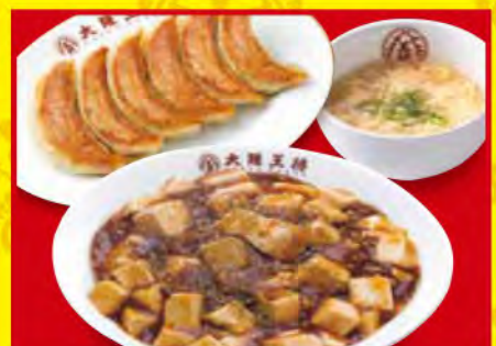
麻婆丼セット ・麻婆丼 ・餃子1人前 ・スープ 1,010円 [税込]