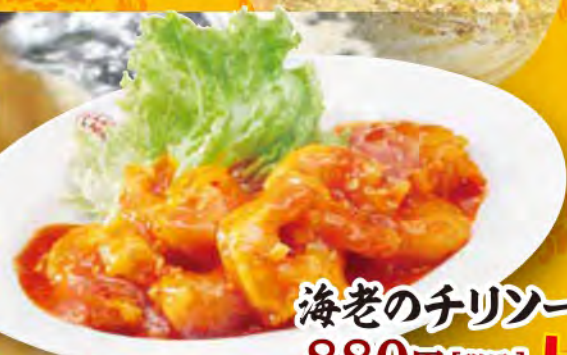
海老のチリソース