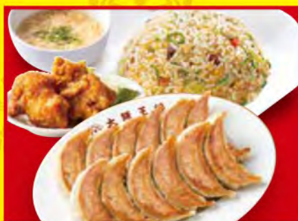
餃子セット ダブル ・餃子2人前 ・五目炒飯 ・唐揚げ(2個) ・スープ 1,340円[税込]