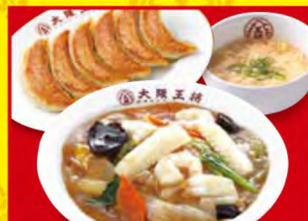
中華丼セット ・中華丼 ・餃子1人前 ・スープ 1,010円 [税込]