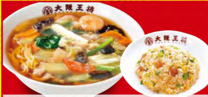
あんかけラーメンセット 1,250円 [税込] ・五目あんかけラーメン ・五目炒飯 (小)