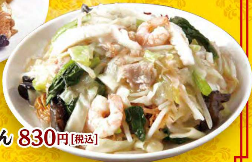
海鮮血うどん 830円 [税込]

麺大盛 +120円 [税込] / 焼きそば・血うどん 麺大盛 +220円 [税込]