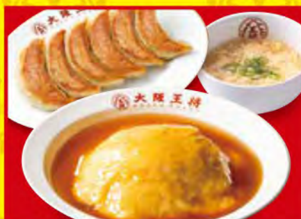
天津餃子セット ・ふわとろ天津飯 ・餃子1人前 ・スープ 850円 [税込]