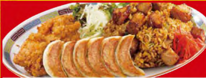
広尾セット 1,020円[税込] ・焼豚炒飯 ・餃子1人前 ・唐揚げ2個 ・サラダ ・スープ