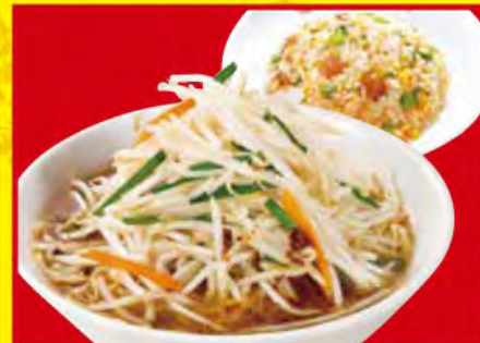
もやしそばセット ・もやしそば ・五目炒飯 (小) 1,180円 [税込]